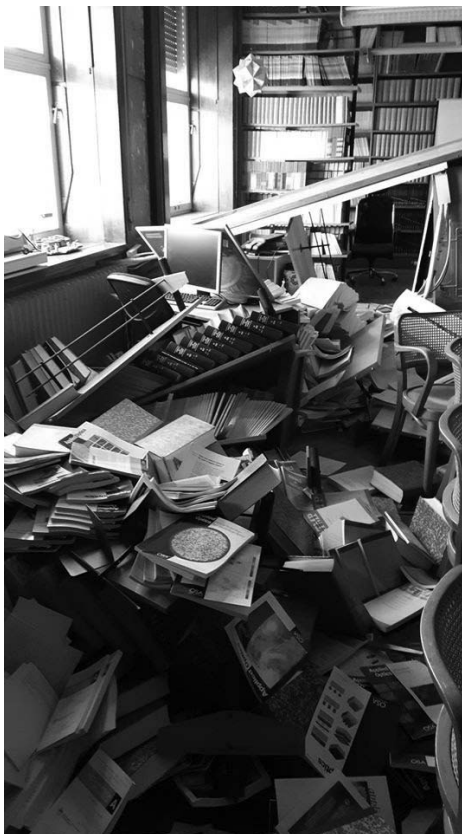
Slika 2: Posljedice potresa u Centru za znanstvene informacije na IRB-u

bile su nekoliko mjeseci zatvorene za korisnike, a danas su, nakon sanacije štete i djelomične reorganizacije smještaja knjižnične građe, ponovno otvorene.