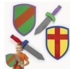
Slika 1: Primjer razmišljanja učenika o dvorcu Borl, uživljanje u ulogu.

Zamisli kratku priču u kojoj se zamišljaš kao plemkinja/plemić dvorca Borl . U opisu ne zaboravi spomenuti tvoje neprijatelje i kako provodiš slobodno vrijeme. Radujem se opisu tvoje dvorske dogodovštine.