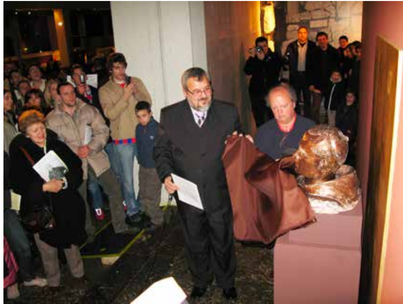
Noć muzeja, siječanj 2008. godine Museum Night, January 2008

Odlaskom Mate Zekana hrvatska arheološka znanost izgubila je vrhunskog stručnjaka i radnika,