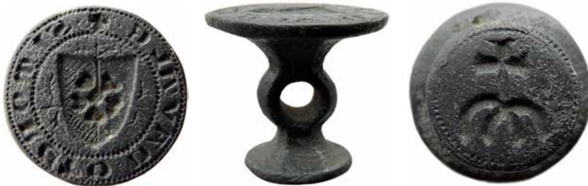
Sl. 2 a-c. Pečatnjak iz Ražanca Fig. 2 a-c The Ražanac seal matrix

Ražanački dvostrani pečatnjak stožasto se sužava od nasuprotnih graviranih polja prema središtu korpusa gdje je okruglo proširenje s kružnom rupom, tj. ušica namijenjena vješanju i nošenju (Sl. 2b). Takvi primjeri poznati su u srednjovjekovnom razdoblju, ali nisu česti dvostrani bikoničnog oblika. Tada se javljaju dva osnovna tipa pečatnjaka: plosnati s hrptom ili malim ispupčenjem na stražnoj strani koji služe kao drške te konični koji se sužava od gravirane pločice prema vrhu drške. 23 Oba imaju rupicu za vješanje na lanac ili uzicu. Konični tipovi učestaliji su od 14. stoljeća nadalje. 24 Kod dvostranih primjeraka, koji se u Europi javljaju od 11. stoljeća, najčešće su zastupljeni upravo plosnati tipovi. 25 Treći tip srednjovjekovnih pečatnjaka je pečatni prsten koji je nešto češći od 15. stoljeća. 26