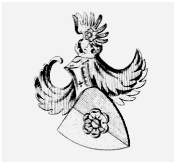
Sl. 4. Grb obitelji Valle iz Trogira (Heyer von Rosenfeld 1873, T. 52)

Fig. 4 Coat of arms of the Valle family from Trogir (Heyer von Rosenfeld 1873, Pl. 52)