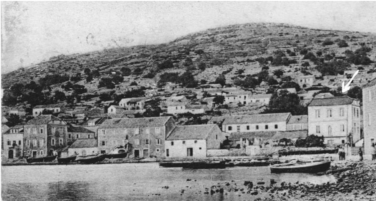
Stara župna kuća (označena strelicom) nalazila se na mjestu današnjeg Zadrugnog doma, a na prijelazu 19. na 20. st. postat će sjedište Općine Vela Luka.

Gotovo svake večeri kroz listopad i studeni, okupljat će se dvadesetak luških mladića pod prozorima luških uglednika i izrugivati im se pjevanjem uvredljivih deseteraca.