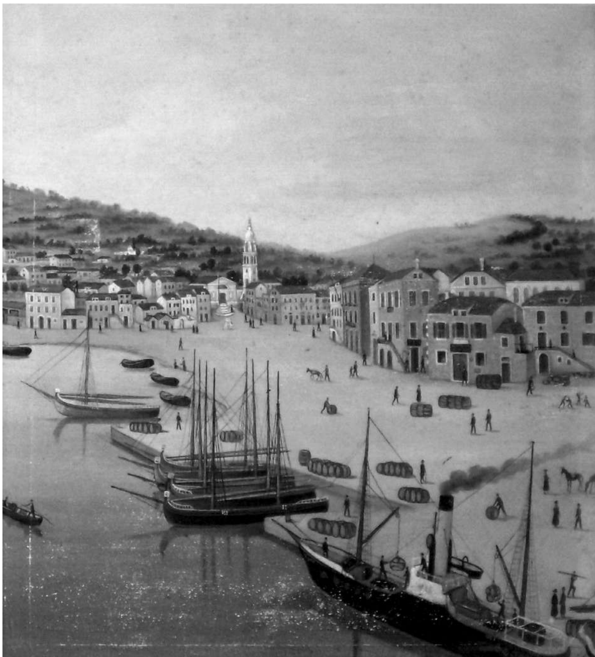
Dio slike J. Riegera s prikazom Vele Luke na samom početku 20. st. Privatna zbirka Saverio Fiorentino (Giovinazzo, Italija)