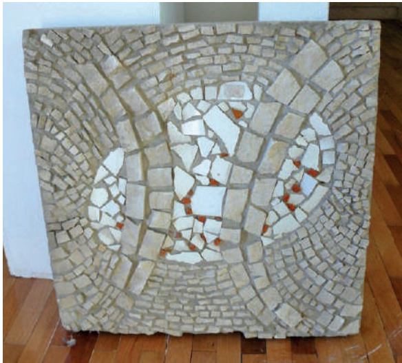
Ciubotaruov mozaik u Centru za kulturu Vela Luka.