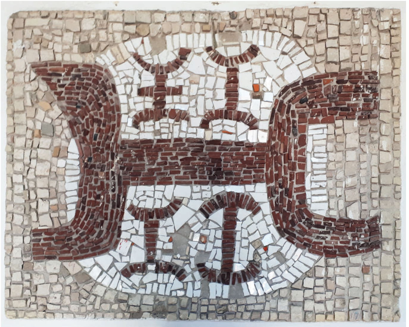
Ciubutaruov mozaik u Osnovnoj školi Blato.