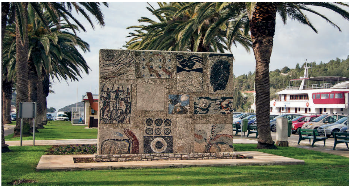
Središnji mozaik pano u Veloj Luci. Ciubotarev mozaik se nalazi pri dnu, drugi slijeva.

Ciubotaru je veliko ime rumunjske likovne i kulturne scene. Rođen je 1939., a diplomirao je 1963. na Institutu likovnih umjetnosti Nicolae Grigorescu u Bukureštu. Od 1990. do 2009. godine bio je profesor na Odsjeku za slikarstvo na Nacionalnom umjetničkom sveučilištu u Bukureštu.