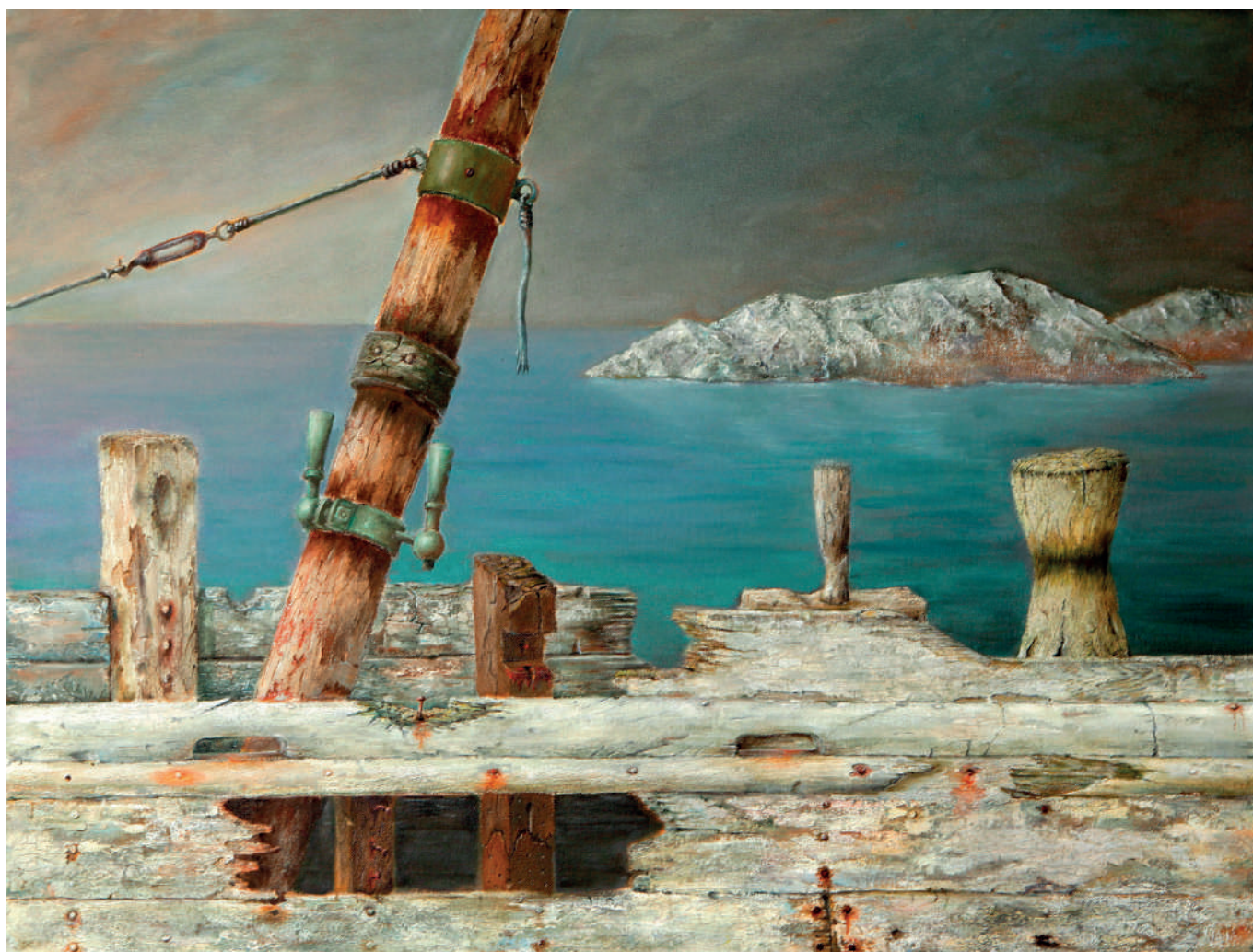
„Putovanje“, ulje na platnu (71x95 cm), 2018.