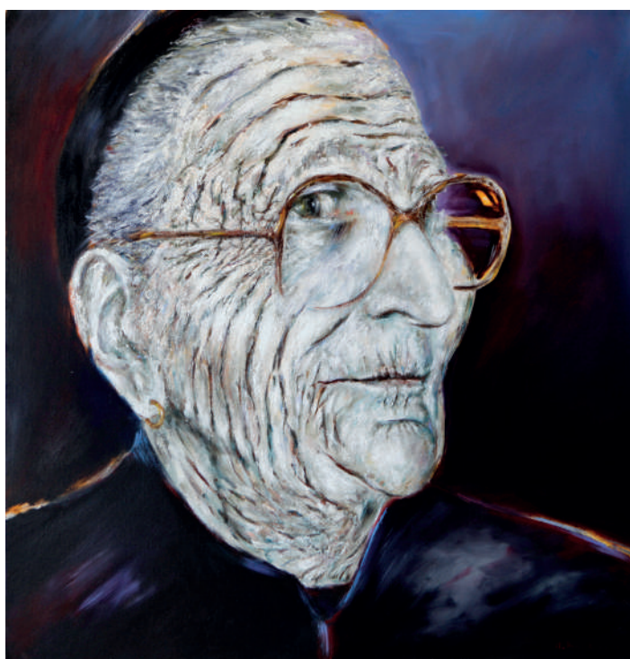
„Baba“, ulje na platnu (73x73 cm), 2014.