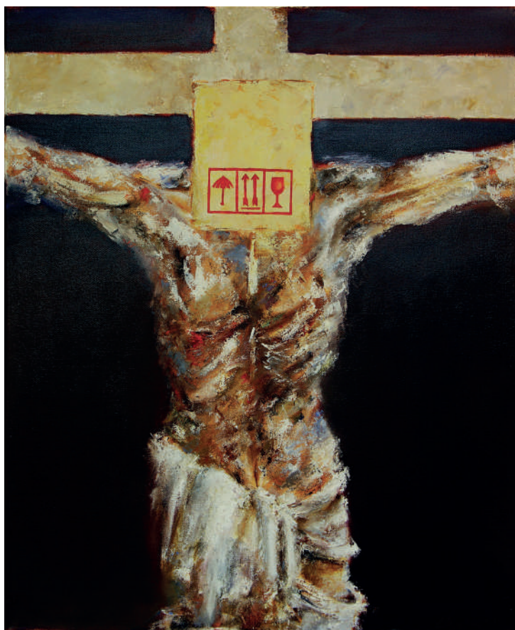
„Lomljivo“, ulje na platnu (80x65 cm), 2002.