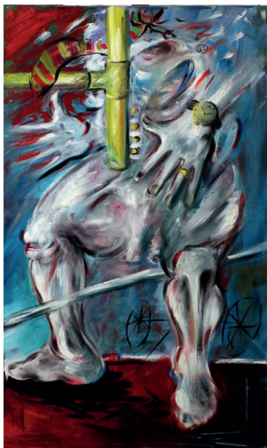
„Autoportret“, ulje na platnu (97x58 cm), 1995.