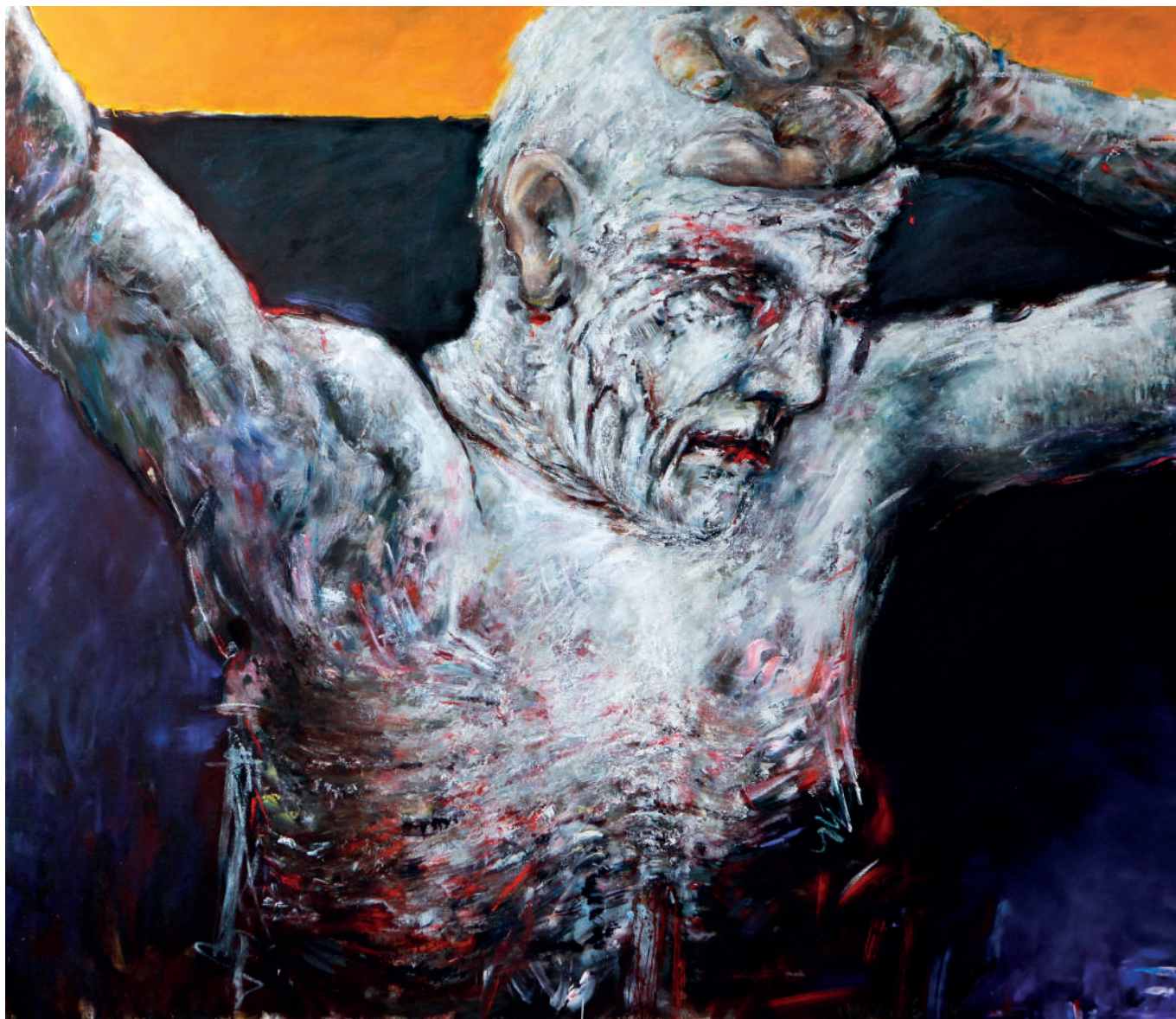
„Mislilac“, ulje na platnu (130x150 cm), 2014.