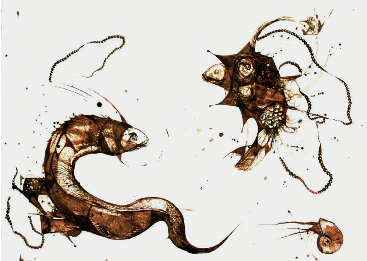
„Nemani“, tuš na papiru (50x30 cm)