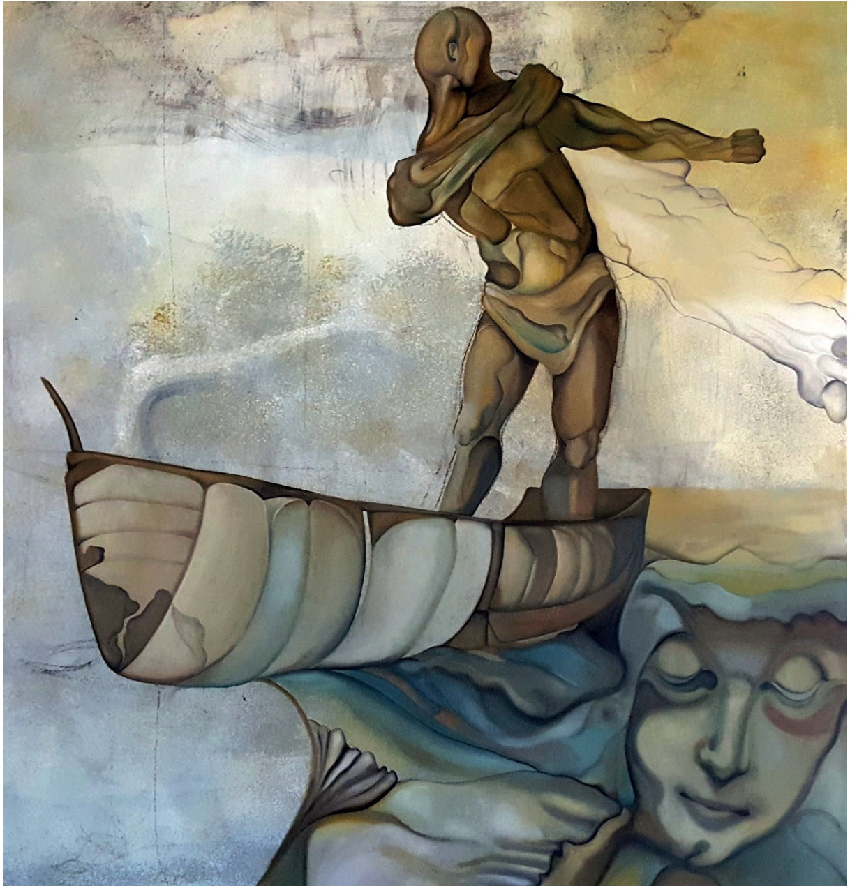
„Daleko od doma“, ulje na platnu (120x120 cm)