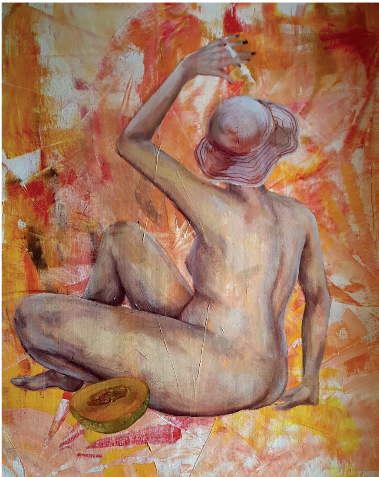
„Kupačica“, akril na platnu (50x60 cm)