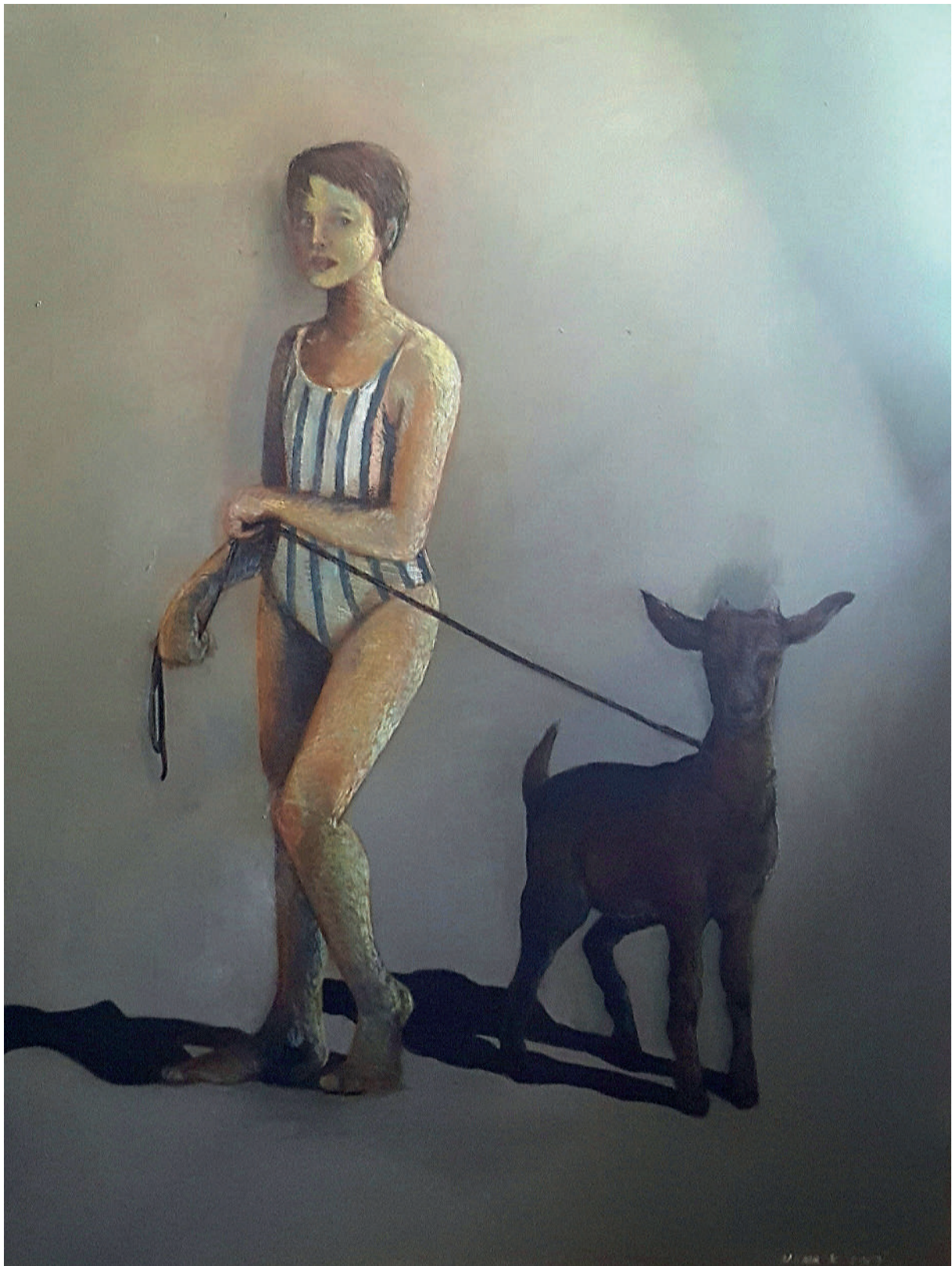
„Djevojčica s kozličem“, akril i uljni pastel na platnu (100x150 cm)