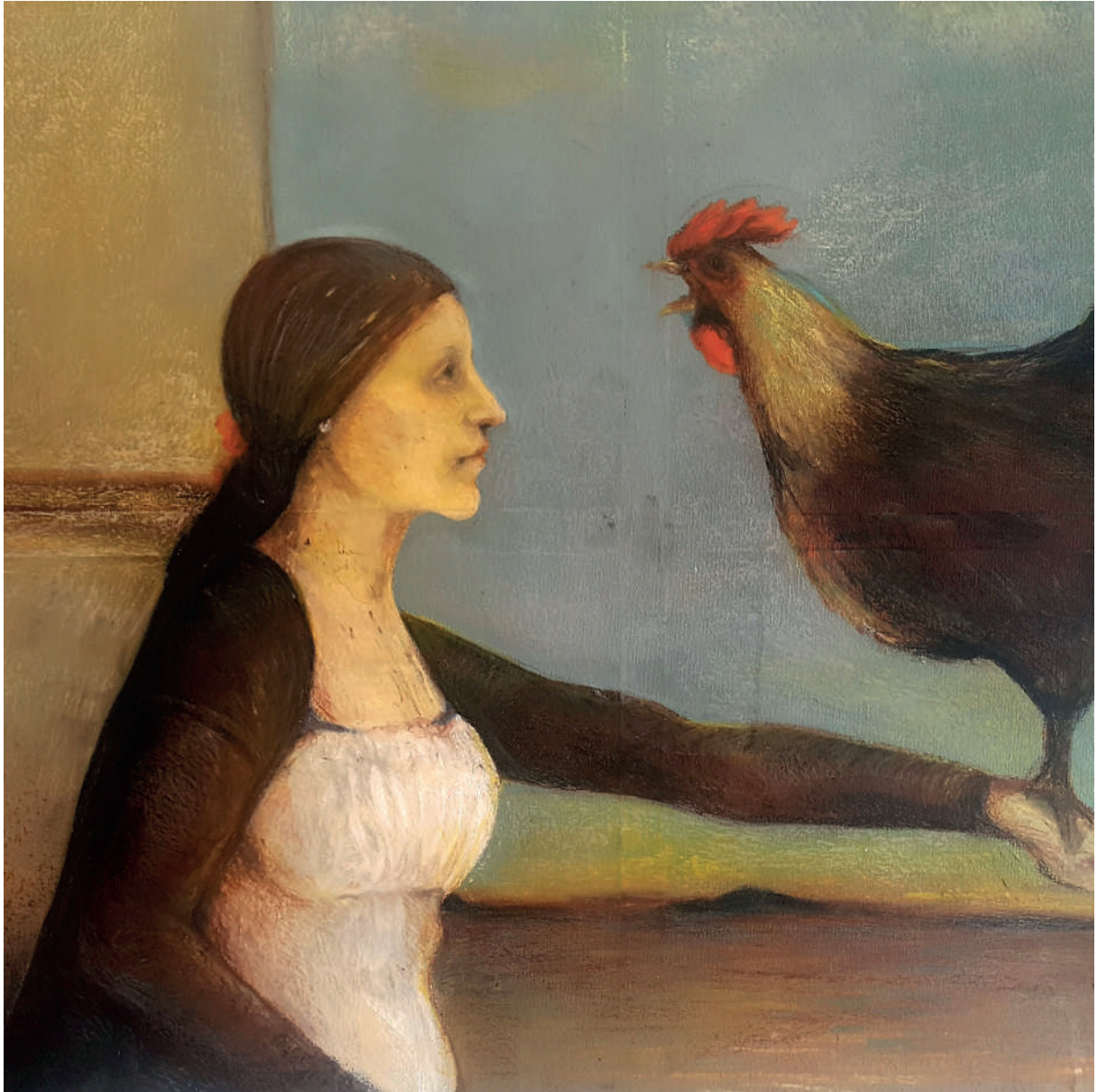
„Mecena“, uljni pastel i akril (100x70 cm)