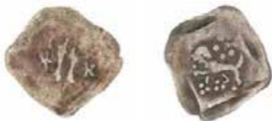
Sl. 15. Pfennig, Bavarska, dinastija Wittelsbacher, Landshut, Ötting, Heinrich IV der Reiche, 1393. - 1450. g. Nalazište: Zečevo kod Kistanja, MHAS 2691

Fig. 15 Pfennig, Bavaria, Wittelsbacher dynasty, Landshut, Ötting, Heinrich IV der Reiche, AD 1393-1450. Site: Zečevo near Kistanje, MHAS 2691