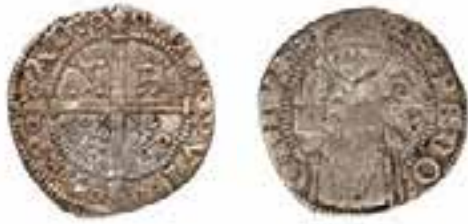
Sl. 1. Padovanski srebrni novac carrarino , 14. st., s nepoznatog nalazišta u južnoj Hrvatskoj

Fig. 1 Paduan silver coin carrarino, 14th century, from an unknown site in southern Croatia