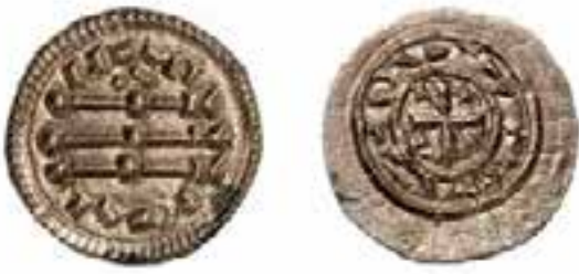
Sl. 5. Denar, Ugarska, Koloman, 1095. - 1116. g. Nalazište: Donji Lepuri - Sv. Martin, MHAS 2911

Fig. 5 Denar, Hungary, Coloman, AD 1095–1116. Site: Donji Lepuri – St. Martin, MHAS 2911 (photo: Zoran Alajbeg)