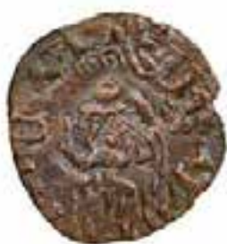
Sl. 7. Folar, Zadar, Karlo Drački, 1372. - 1376. g. Nalazište: Zadar, MHAS 1481 Fig. 7 Follaro, Zadar, Charles of Durazzo, AD 1372–1376. Site: Zadar, MHAS 1481