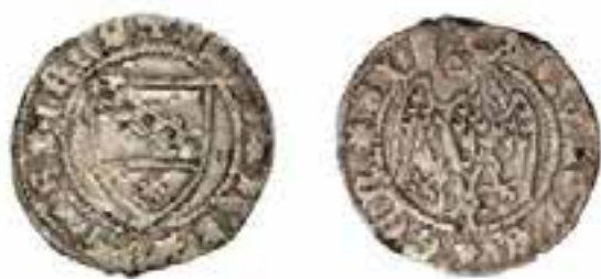
Sl. 3. Denar Akvilejskog patrijarhata, Antonio II., 1402. - 1411. g. Nalazište: Donji Lepuri – Sv. Martin, MHAS 2908

Fig. 3 Denaro of the Patriarchate of Aquileia, Antonio II, AD 1402–1411. Site: Donji Lepuri – St. Martin, MHAS 2908