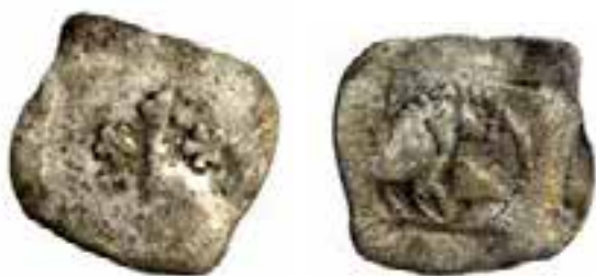
Sl. 18. Pfenig, Bavarska, Landshut, dinastija Wittelsbacher, Ludwig IX. der Reiche, 1450. - 1479. g. Nalazište: Bribir, MHAS 2530

Fig. 18 Pfennig, Bavaria, Landshut, Wittelsbacher Dynasty, Ludwig IX der Reiche, AD 1450–1479. Site: Bribir, MHAS 2530