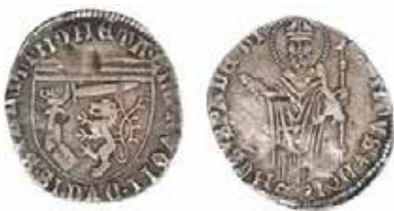
Sl. 10. Groš, Split, Hrvoje Vukčić Hrvatinić, 1409. - 1413. Nalazište: nepoznato, MHAS 1561

Fig. 9 Groschen, Split, Hrvoje Vukčić Hrvatinić, AD 1403–1409. Site: Zvonigrad, MHAS 1562