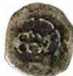
Sl. 13. Pfennig, Bavarska, dinastija Wittelsbacher, Bayern - München, Ernst I. i Wilhelm III., 1397. - 1435. g. Nalazište: Bribir, MHAS 2686

Fig. 13 Pfennig, Bavaria, Wittelsbacher dynasty, Bayern-München, Ernst I and Wilhelm III, AD 1397-1435. Site: Bribir, MHAS 2686