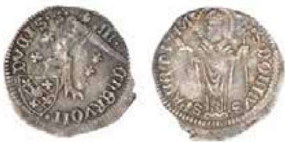
Sl. 9. Groš, Split, Hrvoje Vukčić Hrvatinić, 1403. - 1409. Nalazište: Zvonigrad, MHAS 1562

Fig. 9 Groschen, Split, Hrvoje Vukčić Hrvatinić, AD 1403–1409. Site: Zvonigrad, MHAS 1562