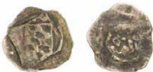
Sl. 17. Pfennig, Bavarska, Amberg Pfalz - Oberpfalz Johann von Neumarkt i Otto I. von Mosbach, 1443. - 1460. g. Nalazište: Vrbnik kod Knina, MHAS 2685

Fig. 16 Pfennig, Bavaria, Wittelsbacher dynasty, Bayern-München, Ernst and Adolf, AD 1435-1438. Site: Bribir - Dol, MHAS 2696