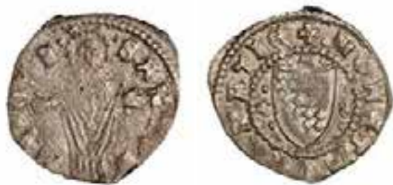
Sl. 12. Mletački soldo za Dalmaciju, 1410. - 1414. g. Nalazište: Donji Lepuri - Sv. Martin, MHAS 2890

Fig. 12 Venetian soldo for Dalmatia, AD 1410–1414. Site: Donji Lepuri – St. Martin, MHAS 2890