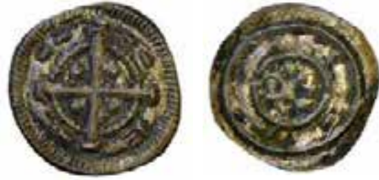
Sl. 6. Denar, Ugarska, vjerojatno Bela II., 1131. - 1141. g. Nalazište: Bribir - Dol, MHAS 1404 Fig. 6 Denar, Hungary, probably of Béla II, AD 1131– 1141. Site: Bribir – Dol, MHAS 1404

Fig. 5 Denar, Hungary, Coloman, AD 1095–1116. Site: Donji Lepuri – St. Martin, MHAS 2911