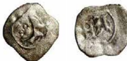
Sl. 16. Pfennig, Bavarska, dinastija Wittelsbacher, Bayern - München, Ernst i Adolf 1435.-1438. g. Nalazište: Bribir - Dol, MHAS 2696

Fig. 15 Pfennig, Bavaria, Wittelsbacher dynasty, Landshut, Ötting, Heinrich IV der Reiche, AD 1393-1450. Site: Zečevo near Kistanje, MHAS 2691