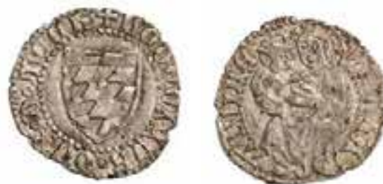
Sl. 4. Denar Akvilejskog patrijarhata, Ludovik II., 1412. - 1420. g. Nalazište: Kula Atlagića – Sv. Petar, MHAS 1392

Fig. 3 Denaro of the Patriarchate of Aquileia, Antonio II, AD 1402–1411. Site: Donji Lepuri – St. Martin, MHAS 2908