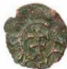
Sl. 8. Obol Zadar, Karlo Drački, 1372. - 1376. g. Nalazište: Zadar, MHAS 1482 Fig. 8 Obol, Zadar, Charles of Durazzo, AD 1372–1376. Site: Zadar, MHAS 1482

Novac je bio predstavljen na prigodnoj izložbi u Zadru 1987. godine. 21 Oba navodno potječu iz samog Zadra. 22