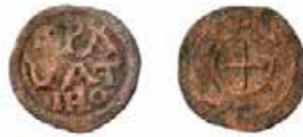
Sl. 2. Splitski dinarić ili parvul, s kraja 13. st. Nalazište: Bribir (foto: Zoran Alajbeg) Fig. 2 Denarino or parvul from Split, late 13th century. Site: Bribir (photo: Zoran Alajbeg)

Fig. 1 Paduan silver coin carrarino, 14th century, from an unknown site in southern Croatia (photo: Zoran Alajbeg)