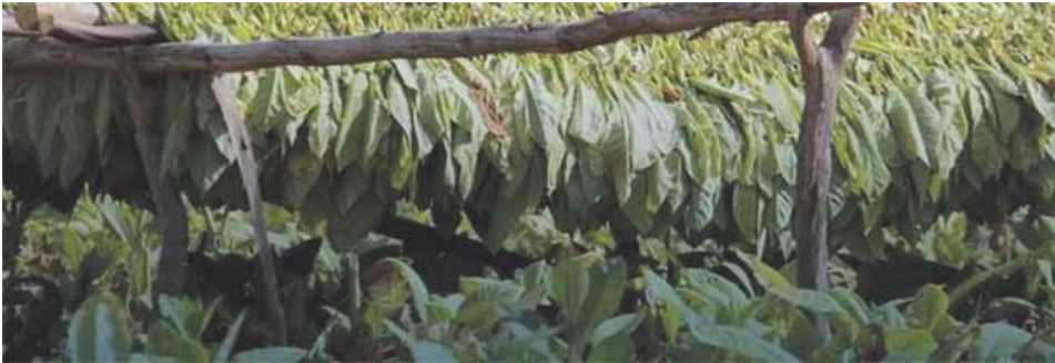
Slika 1. Listovi duhana

ćao i uzgoj. Došlo je do izgradnje duhanskih stanica u Imotskom, Vrgorcu, Dubrovniku, Sinju, Metkoviću i Splitu, a nešto kasnije u Trogiru i Drnišu. U tim je stanicama zapošljavano stručno osoblje za uzgoj duhana, dok su žene i djeca razvrstavali otkupljeni duhan (Vrzan, 2017). Proizvodnja duhana u Istri počinje tek 1923. godine u formi zadruga na području koje omeđuje Poreč, Pazin i Pulu (Bauk, 2015). Uvođenjem radničkog samoupravljanja 1951. godine, osnivaju se poduzeća za otkup i obradu duhana. Od 1954. godine, slavonski i podravski uzgajivači u suradnji sa stručnjacima zagrebačkog Duhanskog instituta počinju saditi dvije nove vrste, burley i svijetla virginia, za koje se pokazalo da im odgovara pjeskovito tlo tog područja (Vrzan, 2017). Epidemija plamenjače, koja je devastirala duhaništa u Dalmaciji i Hercegovini, rezultirala je 1960. i 1962. godine značajnim padom proizvodnje te zatvorenjem duhanskih stanica u Sinju i Drnišu. Duhanska industrija u Dalmaciji je tijekom 1970-ih postupno odumirala (Bauk, 2015).