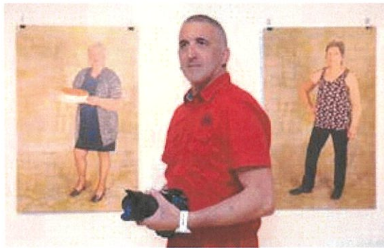
Slika 2.