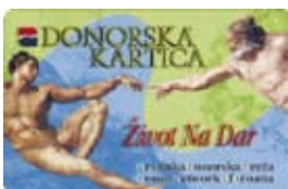
Hrvatska kartica za posmrtno darivanje organa

Kroz niz godina održano je na stotine predavanja, uz multimedijalnu podršku širom Hrvatske, različitim razinama i skupinama stanovništva, sveučilišnim i srednjoškolskim profesorima, studentima i učenicima, liječnicima, vojnim i policijskim djelatnicima, medicinskim sestrama, humanitarnim organizacijama, svećenicima, bolesnicima i građanima, svima koji o tome žele više znati. Napisano je na stotine tekstova intervjuja za razne novine i časopise. Distribucija promidžbenog materijala neprestano se odvijala pa je broj distribuiranih donorskih kartica premašio brojku od 400 tisuća primjeraka. Svaki je građanin potencijalni davatelj, no on je, često se zaboravlja, i potencijalni primatelj organa.