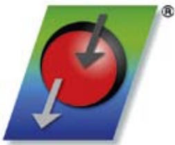
Logotip darivanja koštane srži u Hrvatskoj