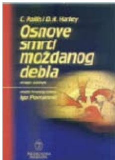
Referentni udžbenik za moždanu smrt

sam početak, no istovremeno i prijeka potreba s obzirom na posljednje mjesto koje u registrima dobrovoljnih davatelja koštane srži Hrvatska zauzima u Europi. Na svojim web stranicama na domeni www.hdm.hr veliki je prostor posvećen tom zapostavljenom segmentu javnog zdravstvenog rada, iako je transplantacija koštane srži u Hrvatskoj započela još sredinom 80-ih godina. Pored toga objavljeno je u medijima niz članaka koji objašnjavaju sve aspekte takvog transplantacijskog liječenja. Akcija je dobila značajni odjek u javnosti. Upravo zahvaljujući tome, najbolji rezultati pri uzimanju uzoraka krvi od građana u okviru Akcije Ane Rukavine postignuti su baš na istarskom području.