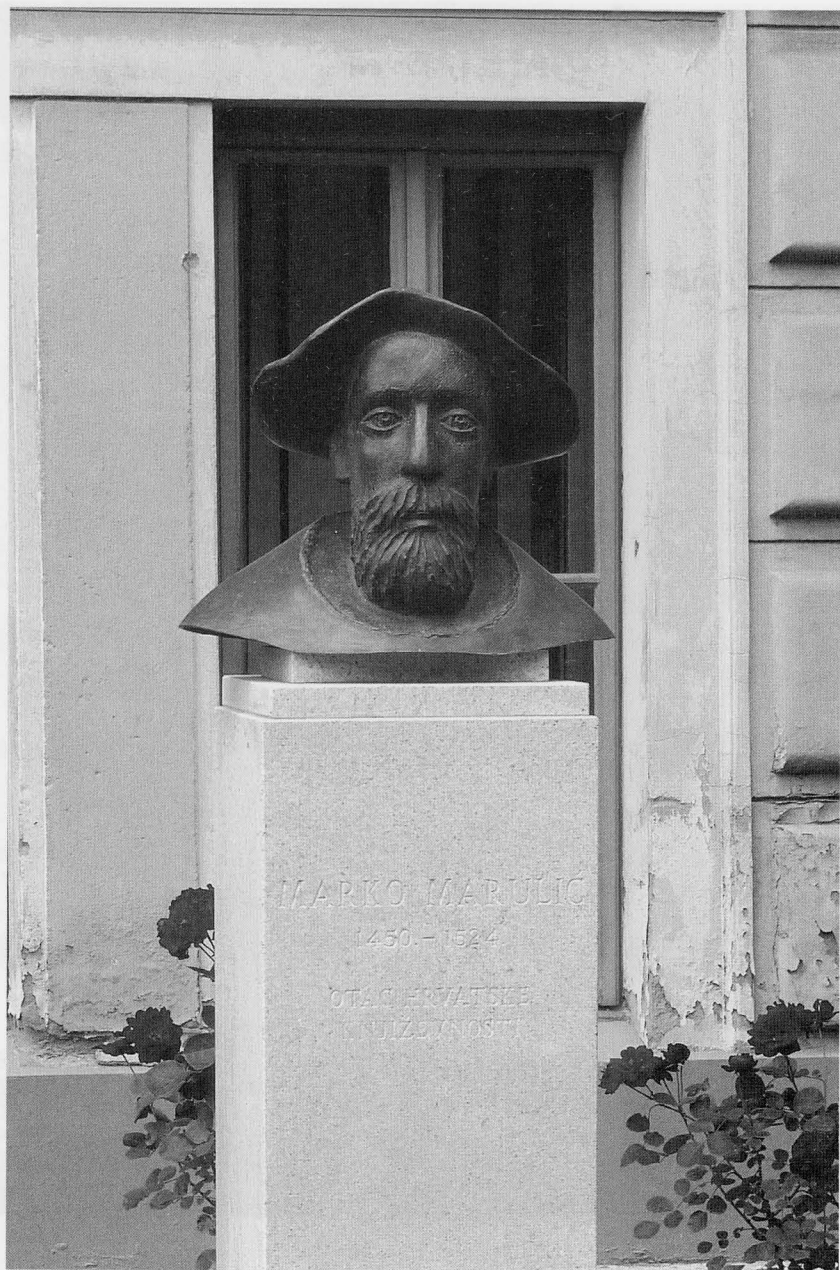
Vasko Lipovac: Poprsje Marka Marulića pred Filozofskim fakultetom u Osijeku (2007)