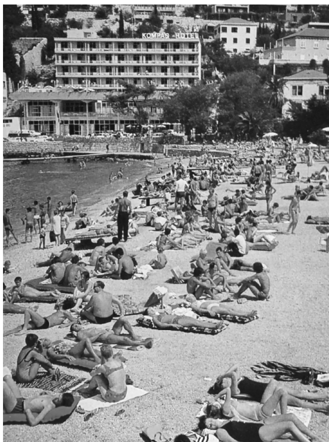
TIHOMIR IVANOVIĆ: HOTEL KOMPAS (DUBROVNIK, 1968.) – IZVORNO STANJE

Posljednja četvrtina 20. stoljeća začetak je razvoja individualiziranog turizma osobne ugone, čije će odrednice i usmjerenja s vremenom početi usvajati i modernistički hoteli koji su osamostaljenjem Republike Hrvatske redom privatizirani. Velike korporacije, u čijem su danas vlasništvu, njihovu opsežnu rekonstrukciju uglavnom ne smatraju