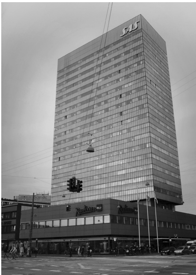
ARNE JACOBSEN: SAS ROYAL HOTEL (KOPENHAGEN, 1960.) – PRIMJER USPJEŠNE PRILAGODBE MODERNISTIČKOG HOTELA UTJECAJIMA SUVREMENIH TURISTIČKIH TRENDOVA; FOTO: BOŽO BENIĆ