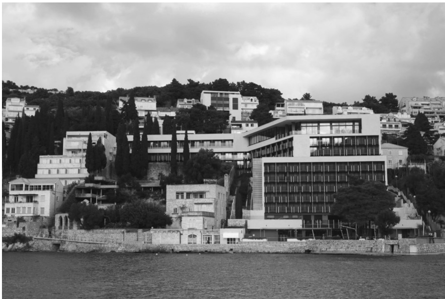
ZORAN BALOG: HOTEL KOMPAS (DUBROVNIK, 2015.) – REKONSTRUKCIJA; FOTO: BOŽO BENIĆ

lim prostorno-funkcionalnim cjelinama hotelskih zgrada kroz vrijeme su se redovito javljale potrebe za najrazličitijim vrstama prilagodbi, a istraživanjima je utvrđeno kako je učestalost, kojom se te prilagodbe odvijaju, bila manja u slojevima konstrukcije i ovojnice, odnosno veća u slojevima instalacija, pregrada i obloga. 9