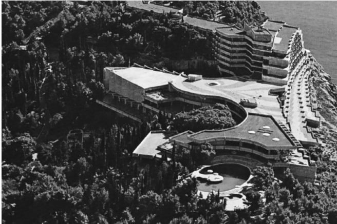
SLOBODAN MILIČEVIĆ: HOTEL CROATIA (CAVTAT, 1973.) – ANTOLOGIJSKI PRIMJER HOTELSKE ARHITEKTURE MODERNIZMA NA DUBROVAČKOM PODRUČJU; IZVOR: CAVTAT AND ITS SURROUNDINGS

pravci. Građevinska obnova ugostiteljskih građevina ograničila se pretežno na hotele, pansionere, ferijalne domove i odmarališta, dok važnost komunalne, regionalne i prometne infrastrukture, sanitarnih mjera, modernizacije građevina, kao i potreba za izgradnjom dodatnih sadržaja za razonodu nije bila prepoznata. U to je vrijeme glavni cilj bio da se što prije i sa što manje sredstava osposobi što veći broj smještajnih kapaciteta te da se time zadovolje potrebe naglo rastućeg turizma. Ako se tome pridoda i nedostatak normativa za gradnju novim materijalima, onda nije neobično da su domaći hoteli sredinom 20. stoljeća umnogome bili ispod europske razine. 2 Ipak, takve okolnosti nisu dugo potrajale. Društveno-političke i gospodarske prilike brzo su se izmijenile naveliko utječući upravo na razvoj turističke arhitekture za koju se danas može ustvrditi kako zbog svojih višeslojnih uvjetovanosti i složenog puta razvoja sadrži neke ključne kreativne karakteristike domaće arhitektonske misli koja je s jedne strane