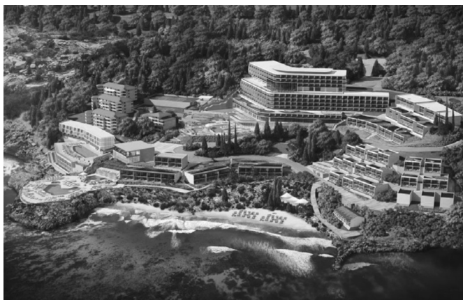
VIZUALIZACIJA KOJA SE SVOJEDOBNO POJAVLJIVALA U MEDIJIMA PRIKAŽUJE PLANIRANI LUKSUZNI RESORT U PLATU NA MJESTU SRUŠENOGA KUŠANOVA HOTELA; VIZUALIZACIJA: BEXELCONSULTING.COM

njih dana. Tako je s namjerom izgradnje novoga turističkog resorta, a unatoč protivljenjima i apelima struke, 2016. godine srušen Kušanov hotel Plat, 14 a ista sudbina prijeti i Fincijevu Pelegrinu i drugim modernističkim hotelima u Kugarima, na čijem je mjestu nedavno usvojenim prostornim