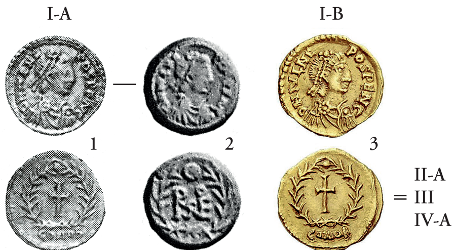
Sl. 1. Primjerci zlatnog i brončanog novca kovani u Saloni u vrijeme vladavine Julija Nepota 474.-475. godine, ca. 2:1. 1 - Tremisa podgrupe I-A, Cahn 24/1912, no. 1932. 2 - Brončani novac kovan istim aversnim kalupom kao i tremisa salonitanske podgrupe I-A, Hirsch 24/1909, no. 2850 (zb. Weber). 3 - Tremisa podgrupe I-B, NAC 56/2010, no. 514.

14/15 (lijevo/desno) na reversu novca. 10 Ne uočavajući spomenute različitosti na sličan način je u luksuznom katalogu Guya Lacama, tiskanom u Parizu desetak godina ranije kovnici u Milanu također pripisano nekoliko tremisa istog kalupa salonitanske I. grupe iz zapadnoeuropskih muzejskih zbirki u Den Haagu i Parizu (La Haye, danas u DNB; BN=BfN). 11 Još brojnija grupa Nepotovih tremisa pripisanih milanskoj kovnici - brojnija prvenstveno stoga jer obuhvaća novac kovan u Nepotovo ime u vrijeme njegove i prve i druge vladavine - okupljena je u katalogu cijenjenog francuskog numizmatičar Georgesa Depeyrot 12 , u kojem se među mnogima ovdje spomenutima navodi i primjerak poznat od ranije, ali dosad neatribuiran Nepotovoj salonitanskoj kovnici 13 , iako njoj nesumnjivo pripada. To je tremisa ponuđena najprije na aukciji Adolfa Cahna u Frankfurtu 1912. godine ( Sl. 1:1 ), 14 a zatim ponovno na aukciji Jakoba Hirscha u Genèvi 1930. godine, 15 na kojoj su dobro vidljivi razlikovni elementi Nepotovih ranih salonitanskih tremisa