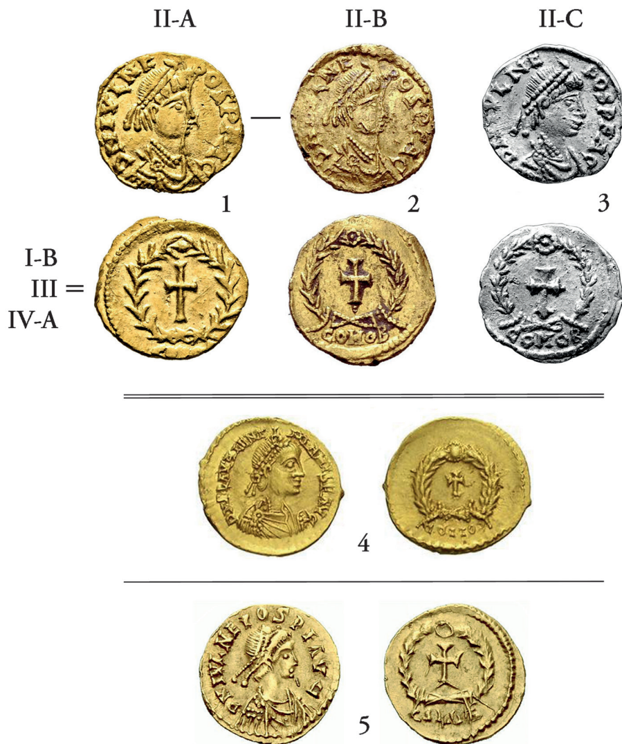
Sl. 2. Tremise kovane u Saloni nakon Nepotova svrgavanja u Italiji i povratka u Dalmaciju u svojstvu cara-izbjeglice 475.-476./477. godine (1-3) i salonitanskim podgrupama II-B i II-C stilistički slične izradbe vijenca i egzerga na pojedinim tremisama Valentinijana III. i Julija Nepota (4-5), ca. 2:1. 1 - Tremisa podgrupe II-A, Rauch 108-1/2019, no. 423. 2 - Tremisa podgrupe II-B, Rauch 96/2014, no. 587. 3 - Tremisa podgrupe II-C, KHM-MK. 4 - Tremisa Valentinijana III kovana u Rimu ili Ravenni, NAC 27/2004, no. 537. 5 - Tremisa Nepota kovana u Arlesu, USB 78/2008, no. 2043 = Ceresio 3/1992, no. 415.