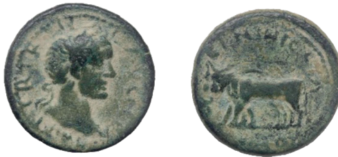
Slika 8. Cilicia ili Kilikija, Ninica Claudiopolis, Trajan. 98.-117. AE 21 (21 mm, 3,82 g). Avers: poprsje Trajana okrenuto u desno. Revers: volovski jaram u pokretu lijevo, vexillum iza. Rabik Product.Nr.:AN1681, RPC IV online 3224; SNG - Aulock 5767.

Na tim prikazima dvopregom upravljaju uglavnom ženska božanstva: Viktorija, Roma, Luna, Venera i Junona. Na novcima koji prikazuju volovski jaram također se izmjenjuju osobe koje njime upravljaju, pa se tako može vidjeti: cara, svećenika ili običnog zemljoradnika.