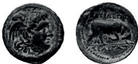
Slika 7. Seleuk I., bronca. Avers: glava Meduze. Revers: razjareni bik.

Taj široki raspon kovnica novca obuhvaćao je cijelo carstvo i bik je bio najčešći prikaz na Seleukovom brončanom novcu. Tip koji se najviše pojavljuje na tim kovanicama jest prikaz Meduze na aversu i bika na reversu .