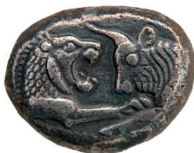
Slika 11. Lavlja i bivolja protoma (sažeti prikaz borbe lava i bika) na srebrnom novcu lidijskoga kralja Kreza, 561.-545. god. pr. Kr.

Objašnjenja tog simbolizma i njegove moći nad drevnim narodima, koji su ga reproducirali s velikim entuzijazmom, kretala su se od toga da predstavljaju suprotstavljene snage života i smrti, da je to izraz kraljevske moći, pa do astronomske aluzije (astronomskog nagovještaja), kao i od utjelovljenja stalne borbe između civilizacije (koju predstavlja pripitomljeni bik) i divlje prirode (koju predstavlja neukrotivi lav.