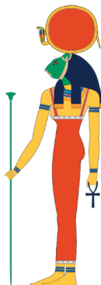
Slika 1. Sekhmet - božica u drevnom egipatskom panteonu. Prikazana s lavljom glavom iznad koje je sunčevi disk s ureusom. Crtež temeljen prema slikama s grobnica Novog Kraljevstva.

ureus * (slika 1.), a Nefertum s glavom lava, 20 što je još jedan od slučaja uparivanja bika s lavom, čime ćemo se baviti u nastavku ovog rada.