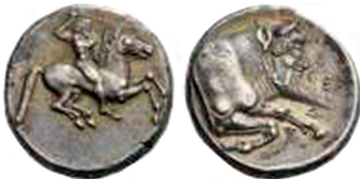
Slika 3. Sicilija, grad Gela, Didrahma, srebro oko 490/85.-480/75. pr. Kr. Avers: Nag i bradati konjanik, jaše desno, maše kopljem u uzdignutoj desnoj ruci. Revers: Protoma bika s ljudskom glavom udesno. Jenkins 8. Kraay & Hirmer 155. Ex Gemini VII, 9. siječnja 2011., 97. i Dr. Patrick Tan Zbirka Numismatica Ars Classica 48, 21. listopada 2008., serija 30.

Posebnost ranih emisija novca grada Gele na Siciliji jest realističnost prikaza njezina zaštitnika grada, riječnog boga Aheloja (grčki Ἀχελῷος), u ovom slučaju Aheloja Gelasa, koji je dobio naziv prema istoimenoj rijeci na sjeverozapadu Grčke (Ahelaj, Ahelos ili Aspropotamos). Ahelaj, u grčkom mitu, riječni bog, sin Okeana i Tetije i njegova borba s Heraklom za lijepu Dejaniru čest je književni i likovni motiv antike. 33 Ahelaj je prikazan u obliku protome bika s ljudskim licem 34 . Taj prikaz koji je izvorno bio samo njegov, postao je iznimno popularan i počeo se koristiti za lokalne riječne bogove diljem grčkoga svijeta. Prikaz nagog i bradatog konjanika na licu kovanice (slika 3.) koji vitla kopljem u uzdignutoj desnoj ruci zapravo je simbolički prikaz progona riječnog boga prikazanog na naličju kovanice, i njegovo sprečavanje da se upusti u jedan od njegovih destruktivnih napada bijesa. Taj bijes manifestira se kroz bujice i poplave koje bi mirne rijeke i potoke Grčke i Magna Graeciae (južne Italije i Sicilije) u trenu pretvorile u latentnu opasnost za lokalno stanovništvo. Taj prikaz također ilustrira složenost simbolike u grčkoj numizmatičkoj umjetnosti, a poruka sigurnosti koju šalje, razlog je rasprostranjenosti prikaza riječnih bogova u obliku protome bika s ljudskim licem.