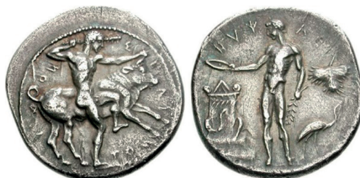
Slika 5. Sicilija, grad Selinunt, oko 455.-440. pr. Kr., srebrna Didrahma, Avers: Herkul stoji desno, držeći palicu iznad glave u desnoj ruci, pripremajući se udariti kretskog bika, kojeg lijevom rukom drži za rog. Revers: riječni bog Hypsas koji stoji lijevo, držeći granu u lijevoj ruci, patera u desnoj, s koje žrtvuje preko oltara obavijenog zmijama slijeva; desno, peršinov list iznad čaplje koja hoda desno.

Već smo spomenuli da je jedno od imena asirskog Boga vatre bilo Nin-İp (Ninip) ili Nerig-on ur ig, što znači Velika vatra , također je bilo poznato i pod imenom Uras, što je vrlo slično nazivu za Velikog bika primitivne Europe, koji se na latinskom zvao Urus, što znači "svjetlo vatre". 37 Ta je riječ opet praktično identična Horusu ili Orusu,