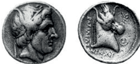
Slika 6. Antioh I., tetradrahma. Avers: glava Seleuka I. s rogovima. Revers: protoma konja s rogovima