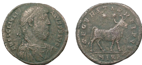
Slika 9. Julijan II., oko 360.-363., dvostruka maiorina, bronca (29mm, 7,5 g), Nikomedia, Asia Minor (danas Turska), Sear 4072, RIC VIII 121, LRBC 2319. Avers: Poprsje Julijana okrenuto desno. Revers: Bik, dvije zvijezde (Blizanci ili Bik), Legenda: "SECVRITAS REIPVB" ili "Sigurnost države".

kršćane, pa su mu oni dali nadimak Apostata (Otpadnik). 55 Uredio je financije i proveo mnoge reforme, ali nije uspio u trogodišnjem pokušaju da kao car oživi štovanje starih bogova. Jedan od tih pokušaja očituje se u instalaciji bika na reversu brončane kovanice dvostruke maiorine. Bik na tim kovanicama najčešće se naziva Apis, božanstvo kojem se, kako smo već spomenuli, prvi put klanjalo u Egiptu oko dvije tisuće godina ranije. Ali to bi mogao biti i Taurus, sveti bik istoimenog sazviježđa.