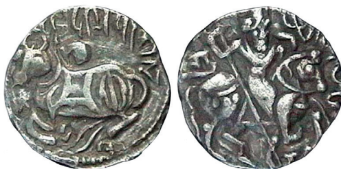
Slika 10. Šah Kabula i Gandhare, Spalapati Deva, srebrni jital, oko 750.-900.

Interesantno je da se nakon islamskog osvajanja zemalja hindu-šaha nije prestalo kovati jitale tipa bik/konjanik. Očito je da su bili dobro prihvaćeni u regiji tako da su muslimanski vladari još nekoliko stoljeća (najmanje do 1300. godine) nastavili izdavanje tog tipa jitala.