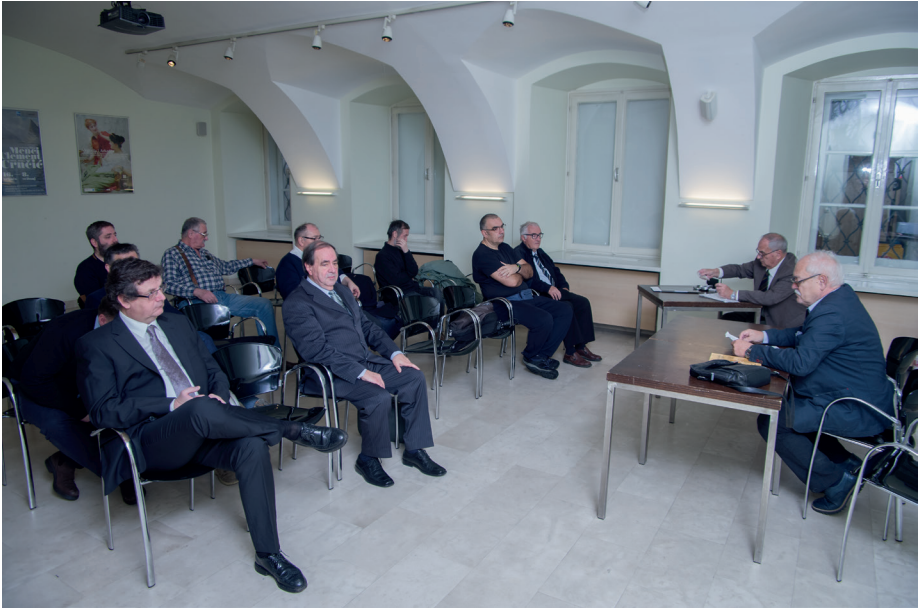
Glavna godišnja skupština HND-a 22. 12. 2019. (Galerija Klovićevi dvori)