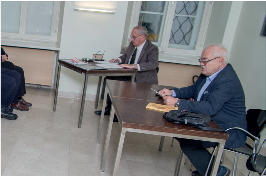
Glavna godišnja skupština HND-a 22. 12. 2019. (Galerija Klovićevi dvori)