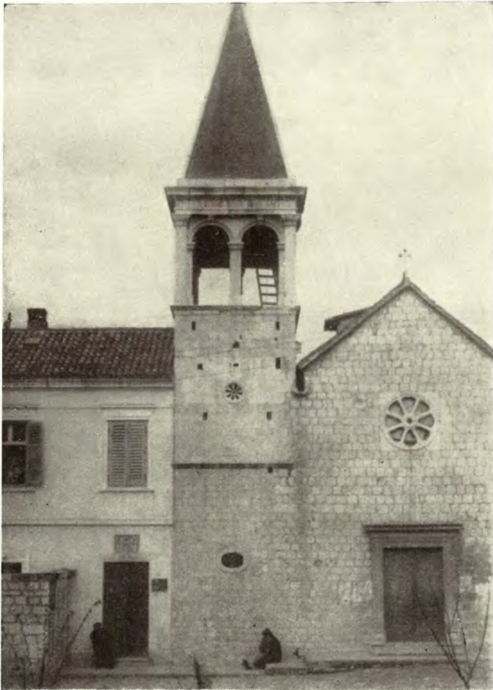
Sl. 2 — Pročelje crkve i ulaz u bivšu bolnicu sv. Lazara u Trogiru