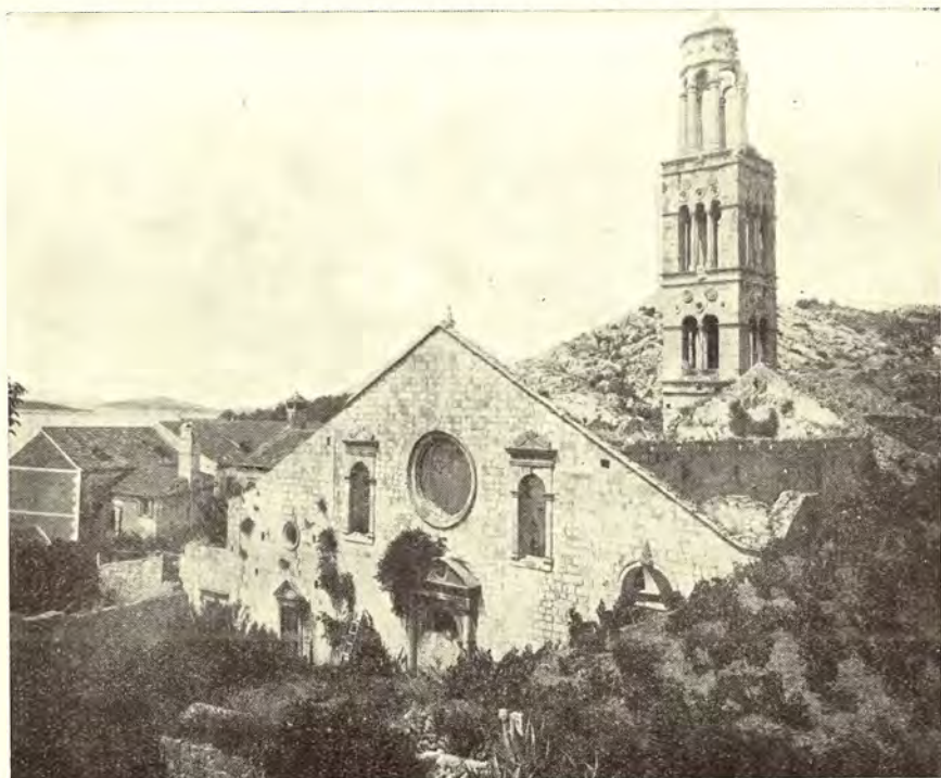
Sl. 1 — Crkva i zvonik sv. Marka u Hvaru