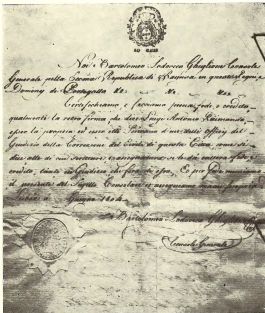
Sl. 1 — Ovjera učinjena od dubrovačkog konzula u Lisabonu lipnja 1805. g.