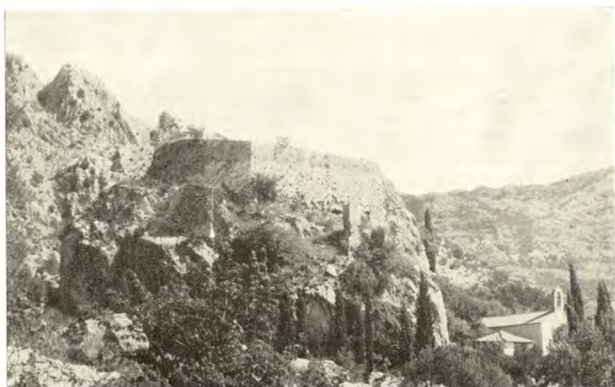
Sl. 2 — Pogled na tvrđavu Sokol sa jugozapada