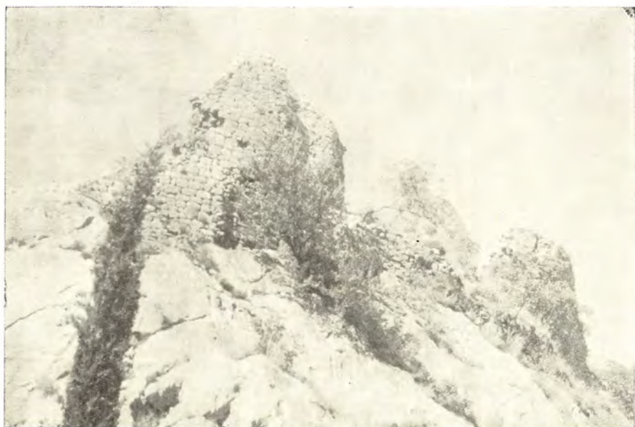
Sl. 1 — Pogled na tvrđavu Sokol sa istoka