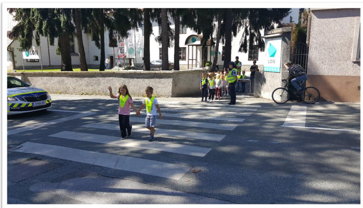
Slika 1: Pravilno prelaženje pješačkog prijelaza