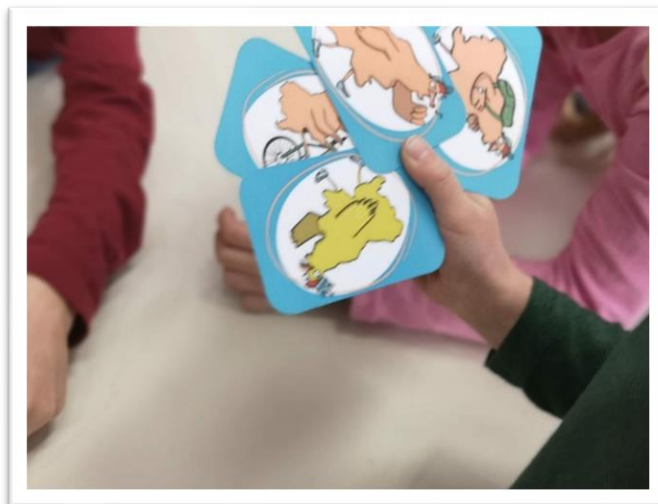
Slika 4. Dječja kartaška igra

Učenike sam podijelio u nekoliko manjih skupina, po četvero. Igrali smo igru na sličan način kao što smo to činili tijekom igre Crni Petar. Pobijedio je učenik koji je najbrže prikupio sve parove i ostao bez karata.