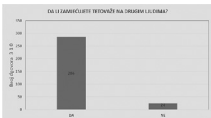
Grafikon 9: Zamjećivanje tetovaže na drugim osobama

Gotovo svi ispitanici, njih 286 ili 93,2 %, primjećuju tetovažu na drugim ljudima, ali 188 (60,06 %) ispitanika nema potrebu saznati više o motivu ili razlozima tetoviranja.