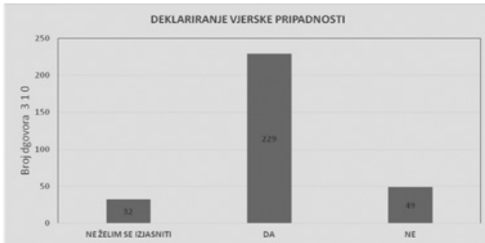
Grafikon 5: Deklariranje vjerske pripadnosti

Velika većina, odnosno 73,9 % ispitanika, izjasnila se da su vjernici. Njih 15,8 % izjasnilo se da nisu vjernici, a 10,3 % nije se željelo izjasniti. Uspoređujući s podacima zadnjega popisa stanovništva iz 2011. godine, kada se katolicima izjasnilo 86,28 %, možemo zaključiti, s obzirom na to da je riječ o uzorku od 310 ispitanika, da je statistički gledano uzorak relevantan za donošenje zaključaka.