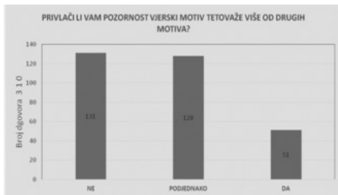
Grafikon 11: Privlačenje pozornosti vjerskoga motiva spram drugih motiva (izvor: autorica)

Tetoviranje vjerskih simbola na vidljivome mjestu prihvatljivim kod vjernika smatra 47 osoba, odnosno 15,2 %. Vjerski motiv privlači veću pozornost ispitanika od drugih motiva kod 51 osobe, odnosno 16,5 % ispitanih. Tetovirani vjerski simboli kod 49 (15,8 %) osoba pobuđuju pozitivan osjećaj. Kod dokazivanja hipoteze (H1) trebaju biti povezane sve značajke s pozitivnom, odnosno s negativnom konotacijom kako bi hipoteza bila potvrđena ili opovrgnuta.