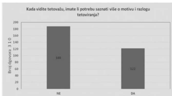
Grafikon 10: Potreba za saznanjem više o motivu i razlozima tetoviranja

Tetoviranje vjerskih simbola na vidljivome mjestu prihvatljivim kod vjernika smatra 47 osoba, odnosno 15,2 %. Vjerski motiv privlači veću pozornost ispitanika od drugih motiva kod 51 osobe, odnosno 16,5 % ispitanih. Tetovirani vjerski simboli kod 49 (15,8 %) osoba pobuđuju pozitivan osjećaj. Kod dokazivanja hipoteze (H1) trebaju biti povezane sve značajke s pozitivnom, odnosno s negativnom konotacijom kako bi hipoteza bila potvrđena ili opovrgnuta.