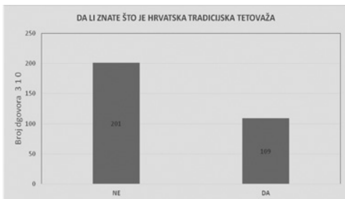
Grafikon 6: Upoznatost s pojmom hrvatska tradicijska/ vjerska tetovaža

Svega 56 (18,1 %) ispitanika ima tetovažu, a većina njih, 179, odnosno 68,3 %, ne bi se tetovirala, dok 214 ispitanih (69 %) ne bi dopustilo djetetu da se tetovira.