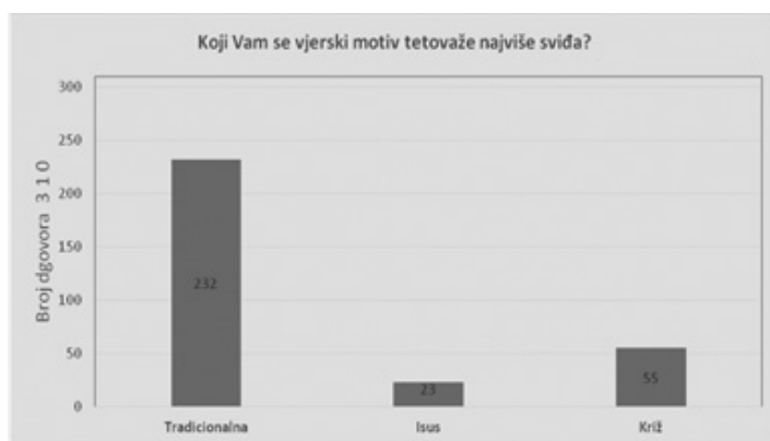
Grafikon 7: Najpoželjniji vjerski motiv tetovaže

Bez obzira na nepoznavanje samoga termina hrvatske tradicijske tetovaže, od tri ponuđena motiva (Isus, križ, tradicijska tetovaža) 232 (74,8 %) ispitanika najpozitivnije je percipiralo motiv tradicijske tetovaže, a njih 182 (58,7 %) izjasnilo se kako im se motiv tradicijske tetovaže sviđa više od drugih vjerskih motiva.