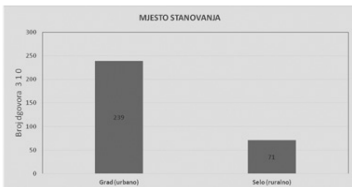
Grafikon 4: Mjesto stanovanja ispitanika/ca