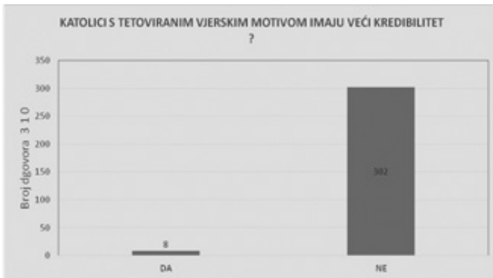
Grafikon 13: Kredibilitet katolika s tetoviranim vjerskim motivom

Da je tetovirana vjerska/tradicijska tetovaža dokaz vjerske pripadnosti, smatraju svega 73 osobe ili 23,5 % ispitanika, a da vjernici s tetoviranim vjerskim simbolom imaju veći kredibilitet, smatra svega 8 (2,6 %) ispitanika. Saznati više o motivu i razlogu tetoviranja potrebu ima 122 (39,4 %) ispitanika, a da je vjerska/tradicijska tetovaža novi način evangelizacije, smatra 38 (12,3 %) ispitanika. Isto tako, čak 302 (97,4 %) ispitanika smatra kako vjernici s tetoviranim vjerskim simbolom nemaju veći kredibilitet.