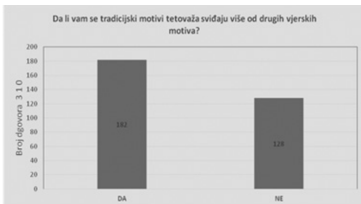
Grafikon 8: Stav u hrvatskome tradicijskom motivu tetovaže u usporedbi s drugim vjerskim motivima

Gotovo svi ispitanici, njih 286 ili 93,2 %, primjećuju tetovažu na drugim ljudima, ali 188 (60,06 %) ispitanika nema potrebu saznati više o motivu ili razlozima tetoviranja.