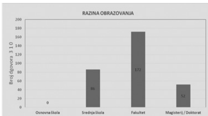
Grafikon 3: Razina obrazovanja