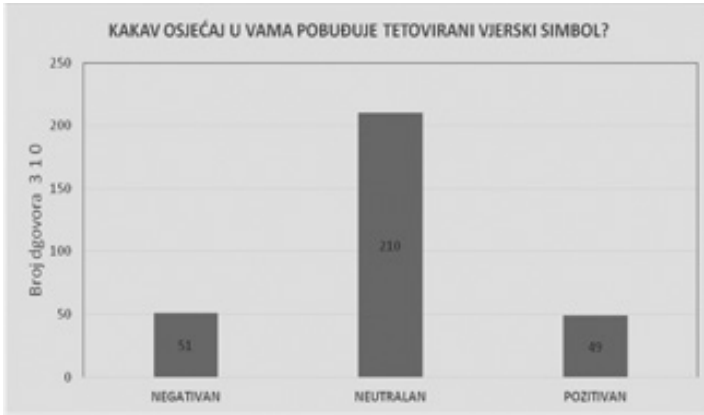
Grafikon 12: Osjećaj koji pobuđuje tetovirani vjerski simbol

Da je tetovirana vjerska/tradicijska tetovaža dokaz vjerske pripadnosti, smatraju svega 73 osobe ili 23,5 % ispitanika, a da vjernici s tetoviranim vjerskim simbolom imaju veći kredibilitet, smatra svega 8 (2,6 %) ispitanika. Saznati više o motivu i razlogu tetoviranja potrebu ima 122 (39,4 %) ispitanika, a da je vjerska/tradicijska tetovaža novi način evangelizacije, smatra 38 (12,3 %) ispitanika. Isto tako, čak 302 (97,4 %) ispitanika smatra kako vjernici s tetoviranim vjerskim simbolom nemaju veći kredibilitet.