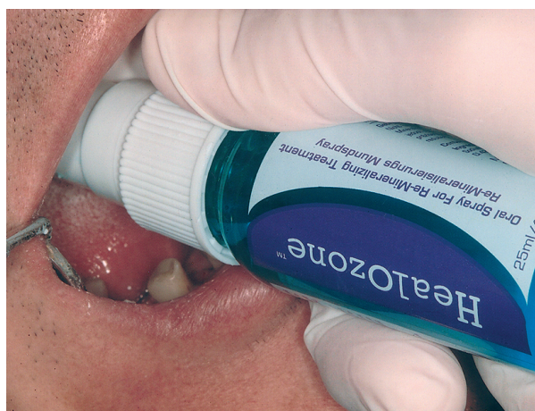
Slika 7. Aplikacija spreja za remineralizaciju Figure 7. Application of the oral remineralization spray

Daljnja klinička i laboratorijska ispitivanja s HealOzonom trebala bi potvrditi njegovu učinkovitost u navedenim kliničkim situacijama te otvoriti mogućnosti njegove uporabe ne samo u terapiji početnih karijesnih lezija i dezinfekciji kaviteta, već i u dezinfekciji korijenskoga kanala te u izbjeljivanju diskoloriranih zubnih kruna.