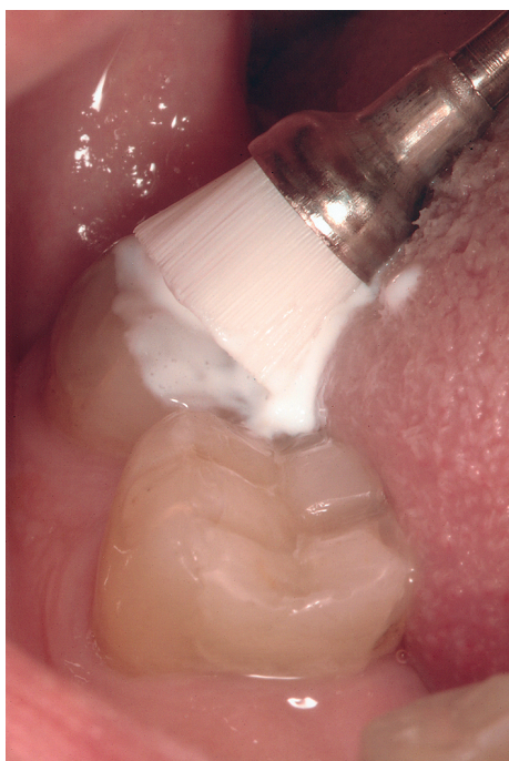
Slika 5. Čišćenje zubne plohe prije aplikacije ozona pastom za poliranje i četkicom Figure 5. Cleaning the tooth surface with the polishing paste and brush

omogućiti bolesnomu tkivu ozdraviti. Na taj način on djelotvorno uništava bakterije koje uzrokuju karijes, i u unutrašnjosti zuba i na njegovoj površini, te s pomoću jakoga dezinficirajućeg učinka omogućuje izlječenje (14, 15).