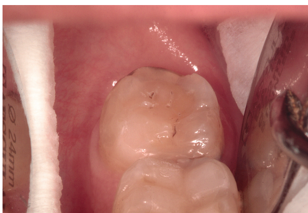
Slika 2. Početna karijesna lezija fisurnoga sustava Figure 2. Initial caries in the fissure system

jesa je njegova jednostavna uporaba, objektivnost u interpretaciji dijagnoze, neinvazivnost, te mogućnost ranog otkrivanja područja demineralizacije (slika 2, 3). Taj uređaj također može dati važne informacije i tijekom praćenja demineraliziranoga područja u određenom razdoblju čime se ponovnom kontrolom precizno utvrđuju eventualne promjene (10).