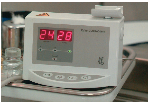
Slika 1. DIAGNOdent uređaj Figure 1. DIAGNOdent unit