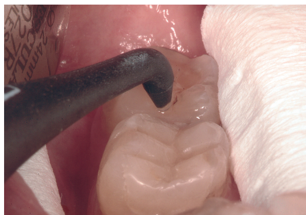
Slika 3. Mjerenje stupnja zahvaćenosti fisurnoga sustava karijesom s pomoću DIAGNOdent uređaja Figure 3. Measuring the degree of caries lesion using DIAGNOdent unit