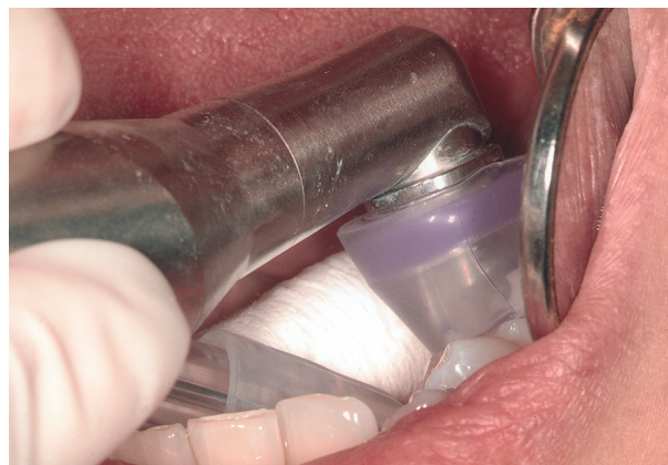
Slika 6a,b. Aplikacija silikonske kapice HealOzon uređaja na tretirani zub Figure 6a,b. Placement of the HealOzone handpiece with silicone caps on the tooth

Budući da je ispuhivanje i usisavanje ozona moguće samo dobro vakuumski postavljenim aplikatorom, onemogućeno je svako štetno djelovanje ozona na pacijenta i terapeuta.