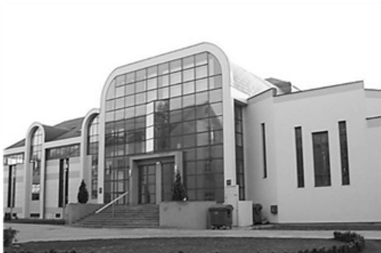
1. Zgrada u kojoj se nalazi Nadbiskupijski arhiv u Đakovu

Parice su rukom izrađene kopije matičnih knjiga krštenih, vjenčanih i umrlih vjernika katolika koje su se vodile za svaku župu nekadašnje Bosanske ili Đakovačke i Srijemske biskupije od 1826. do 1877. godine (ne za svaku župu za svaku godinu u NAĐ-u). Župnik pojedine župe bio je dužan na početku svake nove godine poslati u sjedište biskupije Đakovo rukom izrađenu kopiju matičnih knjiga krštenih, vjenčanih i umrlih (ponekad i vrlo rijetko i neke druge: npr. krizmanih) vjernika katolika za prošlu godinu, dok je izvornik (matične knjige) ostajao u samoj župi. Ovaj se postupak provodio radi zaštite podataka koji su zabilježeni u maticama, odnosno paricama – ako bi izvornik bio uništen u župnom domu, ostao bi sačuvan primjerak iz sjedišta biskupije (Đakova) i obratno. Određeni dio matičnih knjiga sa župa oduzet je Katoličkoj Crkvi nakon kraja 2. svjetskog rata od strane komunističkih vlasti i danas se dobrim dijelom te knjige nalaze u matičnim uredima ili državnim arhivima.