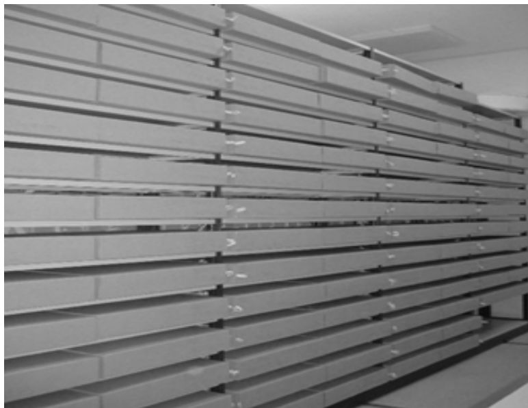
2. Smještaj parica u spremištu NAD-a