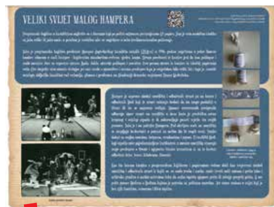
Veliki svijet malog hampera, Arhiv ZKM-a na izložbi „Priče iz arhiva“

zbornike tih skupova. U tijeku je projekt izrade Međunarodnog registra izvedbenih umjetnosti s detaljnim informacijama o zbirkama izvedbenih umjetnosti, a ustanovljena je i radna skupina koja se bavi njihovom dokumentacijom u digitalnom okruženju. U tijeku je priprema konferencije koja će se održati u drugoj polovini svibnja 2021. godine u Varšavi.