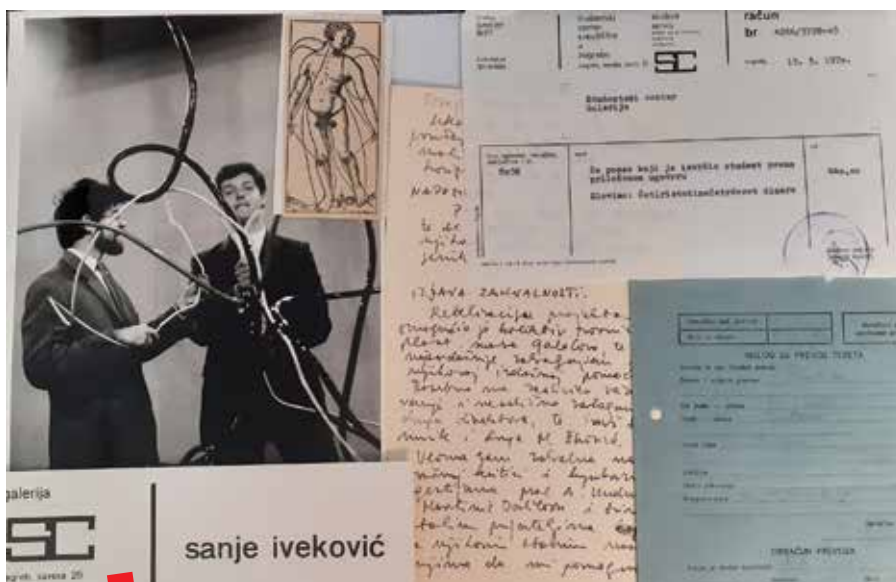
Grada Arhiva Galerije SC

Kako je Galerija Studentskog centra od svojeg osnutka 1961. svojom programskom orijentacijom postala eksperimentalnim poligonom za mlade umjetnike, interes domaće istraživačke zajednice za tu je dokumentaciju bio sporadično prisutan i u pred digitalnom razdoblju. Međutim, taj se interes znatno povećao devedesetih, kada se simbolički s „padom“ Berlinskog zida, otvara pitanje redefiniranja okvira dominirajuće „zapadne“ povijesti