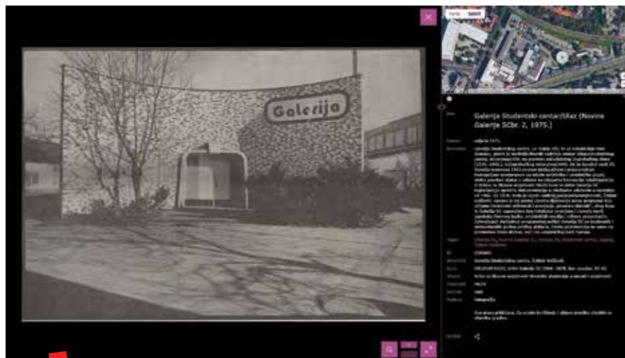
Građa Arhiva Galerije SC na Topoteci Sveučilišta u Zagrebu (Novine Galerije SC), 2020.

centra, upravo zbog činjenice da je ona u svojoj programskoj orijentaciji nosila elemente negacije većine onih zakonitosti prema kojima jedan galerijski sustav funkcionira, uspostavljajući neke nove odnose umjetnosti prema društvu i društva prema umjetnosti. Dok su jedni za svoja istraživanja našli dovoljno materijala u digitaliziranom sadržaju, drugi su, nakon spoznaje o postojanju šire dokumentacije, došli i osobno u Arhiv. Na taj se način u zadnjih par godina građa Arhiva SC-a našla u više znanstvenih publikacija u izdanjima The Courtauld Institute of Art, London i MIT Press-a. To potvrđuje izuzetnu važnost makar i djelomične digitalizacije, budući da je vidljivost sadržaja, neovisno o njegovoj količini, dovoljna da bi se pružila informacija i prenijelo znanje.