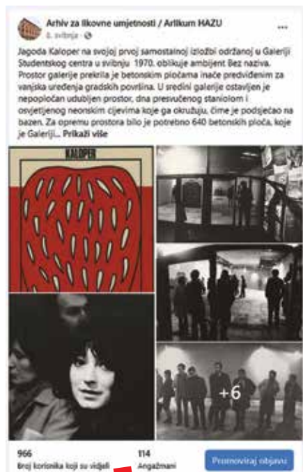
Facebook objava, svibanj 2020. – prva samostalna izložba Jagode Kaloper u Galeriji SC 1970.

točka bila odabir građe relevantne za istraživače. U slučaju Arhiva Galerije SC odlučeno je da se krene s digitalizacijom fotografija izložaba, čiji su autori (ugledna imena poput Petra Dabca, Enesa Midžića, Vladimira Jakolića i dr.) kao stalni suradnici Galerije fotografski dokumentirali svaku izložbu, od njezina otvorenja do postava, autora, sudionika i posjetitelja, stvorivši fotografsku „bazu“ brojnih dragocjenih, autentičnih, često nigdje zapisanih informacija. Digitalizirane fotografije obogaćene su metapodacima, koji uz umjetnike uključuju i autore fotografija, te pojedine (pre)poznate posjetitelje, među kojima su i mnogi istaknuti umjetnici. Svaka se fotografija pomoću posebno razvijenog modula može preuzeti u PDF formatu, uz prateće metapodatke u kojima je navedena i odgovarajuća licenca, odnosno uvjeti i način njezinog korištenja. Uslijedili su brojni kontakti istraživača, mahom iz inozemstva, čiji je interesni fokus bio na tzv. subverzivnim umjetničkim djelovanjima u državama socijalističkog uređenja, koja nisu mogla zaobići djelovanje Galerije Studentskog