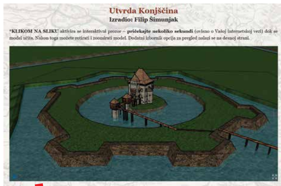
3D rekonstrukcija utvrde Konjščina