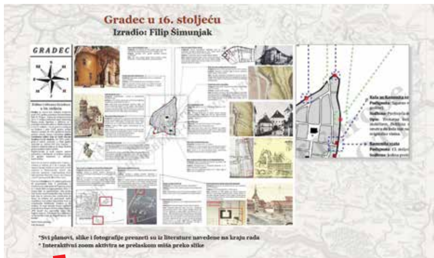
Interaktivni grafički prikaz (primjer fortifikacija zagrebačkog Gradeca).

Projekt je započeo u sklopu kolegija „Uvod u istraživački rad“, nositeljice prof. dr. sc. Nataše Štefanec, na kojemu je grupa studenata transkribirala i obradila za sada najraniji poznati krajiški popis ( Kriegsstaat ) iz 1556. godine, pisan njemačkom goticom. U programu Google Maps izrađena je prateća interaktivna karta Vojne krajine (1556.), pripadajuća tablica s podacima te uvodni tekst. Izrađena je prateća interaktivna karta Vojne krajine (1556.), u programu Google Maps, prateća tablica s podacima i uvodni tekst. Na stranici su obrađene i najvažnije osobe i utvrde koje popis spominje. Mrežna stranica projekta svojevrsna je baza podataka koju tijekom narednog desetljeća želimo dopunjavati novim materijalima. Sučelje stranice u potpunosti je