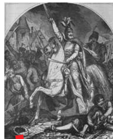
Nikola Jurišić – vojnik, diplomat i spasitelj Beča