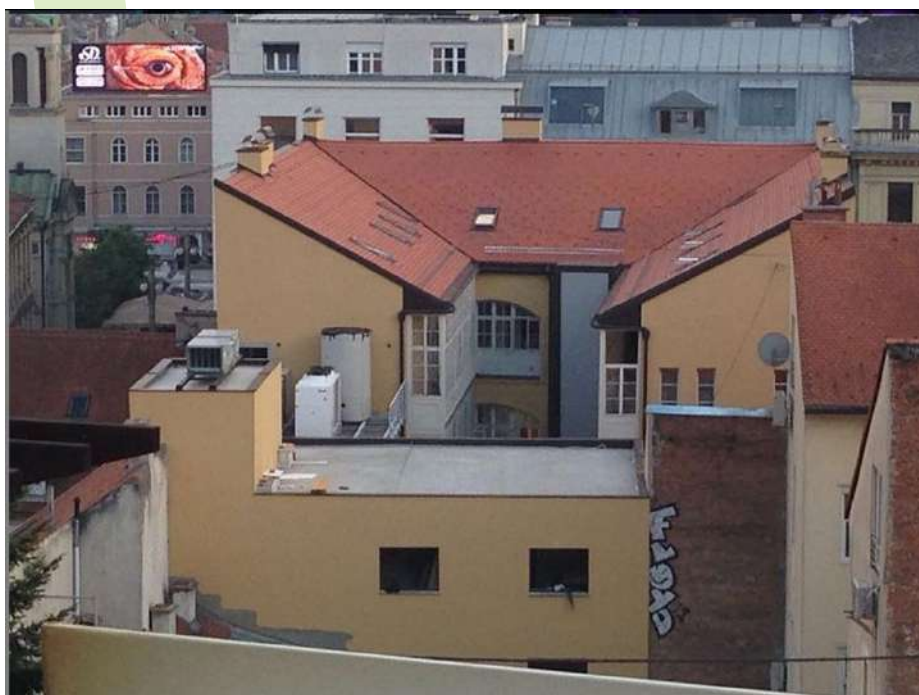
Slika 1. Grad: stanovanje, povijesno-kulturna baština, suvremene kulturne aktivnosti (Zagrebački plesni centar), gospodarska djelatnost, ključni prometni pravci – sve se susreće i isprepliće na malom prostoru

Dva su ključna aspekta za međudjelovanje održive potrošnje i proizvodnje – građani kao akteri, jer svi smo mi i potrošači i proizvođači, i na nama je da donosimo održive odluke u obje svoje uloge te prostor u kojem se aktivnosti potrošnje i proizvodnje odvijaju, a to je najčešće grad ili naselje. Gradovi imaju veliku moć privlačenja. Privlačnost i posebnost nekog grada definiraju njegovi stanovnici, jer grad bez stanovnika samo je prazna scenografija. Ljudi žive u gradovima da bi iskoristili prilike za ostvarenje u poslovnom i privatnom životu. Gradovi tako privlače vlastite stanovnike da se ne odsele negdje drugdje, ljude iz bliže i šire okolice koji se doseljavaju ili samo koriste neke usluge koje grad nudi, ali i turističke posjetitelje izdaleka. Ljudi dolaze u grad raditi i razmjenjivati poslovne ideje jer su gradovi poslovni inkubatori, ali dolaze i uživati u kulturi i provoditi