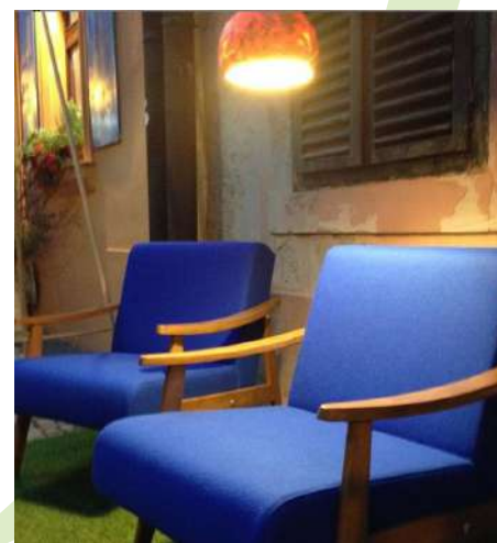
Slika 2. Primjer ponovne upotrebe prethodno odbačenih predmeta i inovativne upotrebe svakodnevnih lokalnih materijala - restaurirani namještaj i lampa izrađena od tikve (Špancirfest, Kreativnica, Uska ulica, Varaždin, 2019., fotelje Smetnjak i lampa Tikvan)

Plastika i elektronika koju svakodnevno koristimo, a koje se danas izuzetno teško recikliraju, inspiracija su mnogim start-up poduzećima da razviju nove tehnologije za recikliranje i ponovnu upotrebu, i prilika su za suradnju zajednice sa sveučilištima, prilika za istraživanje i za prijenos tehnologije i poticaj lokalnog gospodarstva. Zaštita prostora u gradu: Kružna ekonomija nužna je za poboljšanje zaštite okoliša u gradovima jer se brine o materijalima koji prolaze kroz ruke građana, potrošača i proizvođača. Drugi je aspekt zaštite okoliša u gradovima zaštita samog prostora grada. Na području arhitekture razvijaju se koncepti i već se grade projekti na principima re-use arhitekture - ponovno korištenje već izgrađenog prostora (brownfield) na efikasniji i održiviji način i regeneriranje gradskih prostora na taj način, rješenja bazirana na prirodnim datostima, a ne u sukobu s njima, u kojima se priroda tretira kao ko-arhitekt, kružni poslovni modeli u izgradnji u kojima se koriste dijelovi srušenih zgrada, a nove zgrade se grade na način da ih je lako rastaviti i ponovo upotrijebiti. Ovo je također područje gospodarstva koje inovatorima omogućuje potencijalno vrlo visoku dodatnu vrijednost jer se tehnologije modularne izgradnje ili izgradnje od postojećih ponovno upotrijebljenih elemenata tek razvijaju. Zbog toga je potrebno da