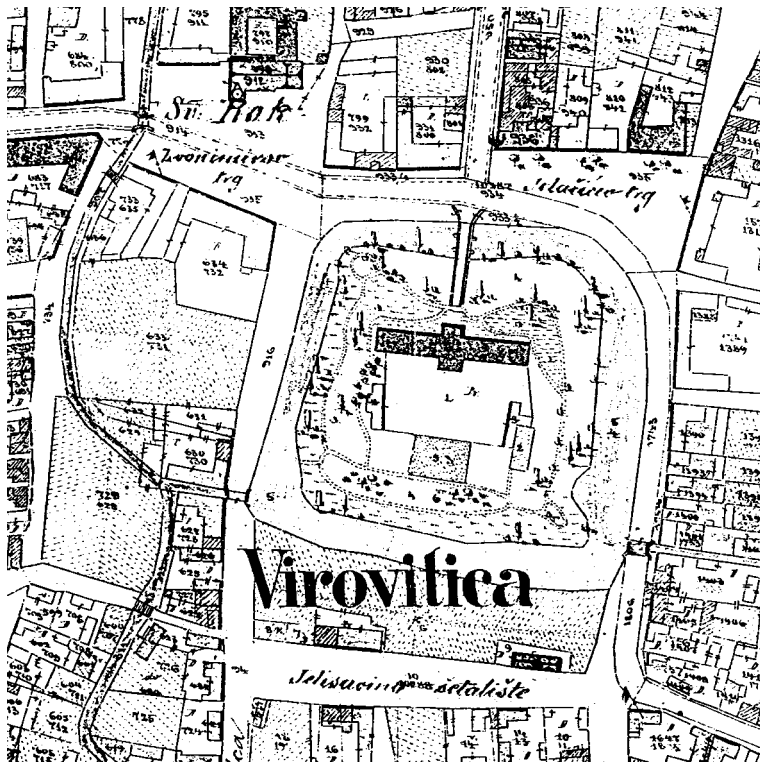
SL. 1. Katastarska karta, 1862, reambulirana 1900, izvorno mjerilo 1:2880