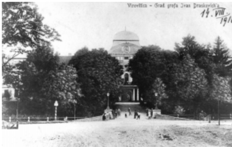
SL. 5. Ulaz u vlastelinski perivoj i dvorac, razglednica iz 1916. g.