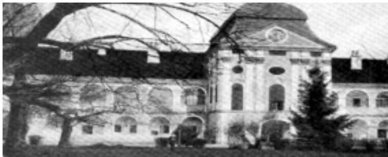
SL. 7. Južno pročelje dvorca, razglednica s početka 20. st.