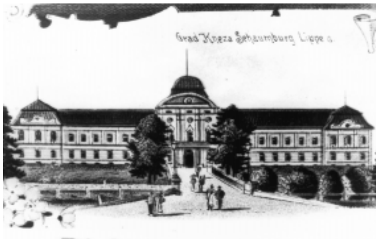
SL. 3. Sjeverno (ulazno) pročelje dvorca, razglednica s početka 20. st.