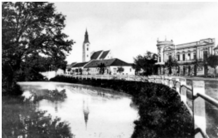
SL. 4. Sjeverni jarak oko dvorca, razglednica iz 1909. g.