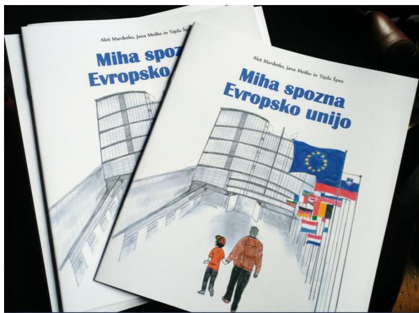
Slika 3: Naslovnica slikovnice Miha spozna Evropsko unijo

Slikovnica Miha upoznaje Evropsku uniju [5] nastavlja priču iz prve dvije knjižice i djeluje svježije i razigrano. Knjižica govori o stvaranju Evropske unije, karakteristikama, idejama i ciljevima Evropske unije. Uz pomoć europarlamentarca Franca Bogoviča poučna knjižica došla je u svaku slovensku osnovnu školu i knjižnicu.