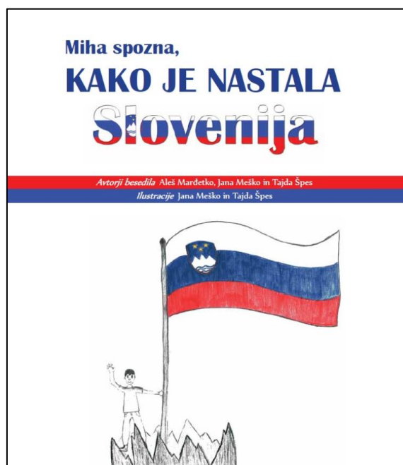
Slika 1: Naslovnica slikovnice Miha spozna kako je nastala Slovenija

Slikovnica je zasigurno važan knjižni doprinos razumijevanju slovenske povijesti i neovisnosti. Njegova je vrijednost također velika jer su je napisali osnovnoškolci. Knjiga je dokaz da ne trebaju presude i predrasude o osnovnoškolskoj djeci i mladima, da ne znaju dovoljno o povijesti svoje zemlje i njenim simbolima.