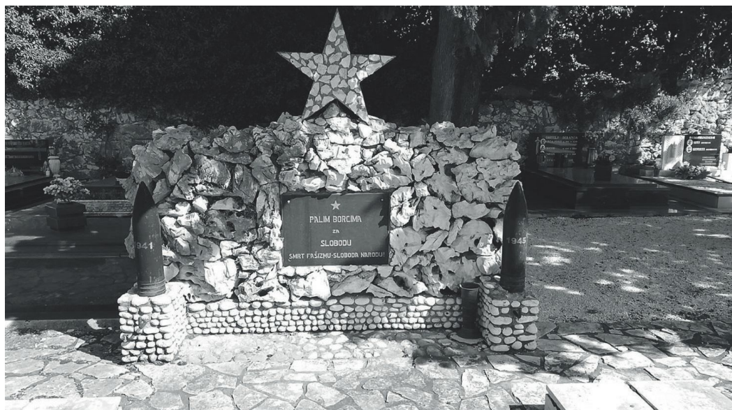
Prilog 2. Kameni podest u sklopu spomen groblja na gradskog groblju, Novi Vinodolski, foto: Karla Tomaš, 2020.