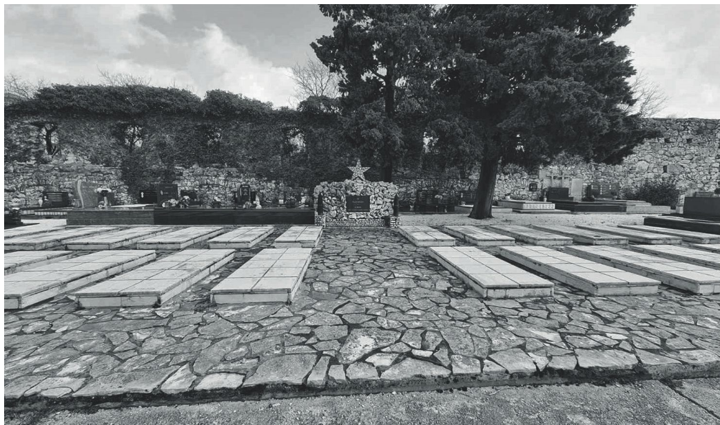
Prilog 3. Spomen groblje na gradskom groblju, Novi Vinodolski, foto: Karla Tomaš, 2020.

Časopis za povijest Zapadne Hrvatske, XIV. i XV./14. i 15., 2019.-2020.