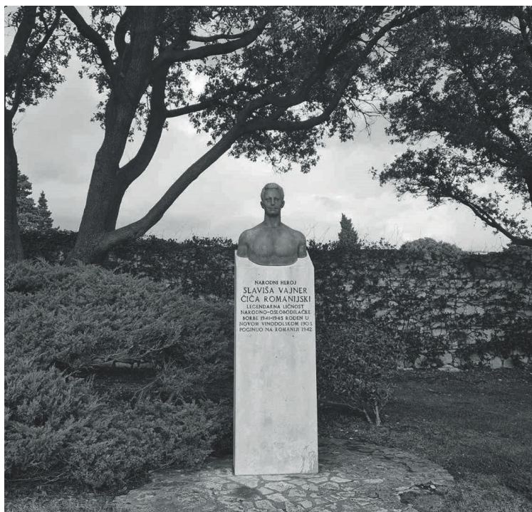
Prilog 4. Bista narodnog heroja Slaviše Vajnera Čiče Romanijskog, Novi Vinodolski, foto: Karla Tomaš, 2020.