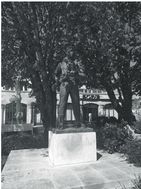
Prilog 1. Spomenik palim borcima u narodnooslobodilačkom ratu 1941.-194, Novi Vinodolski