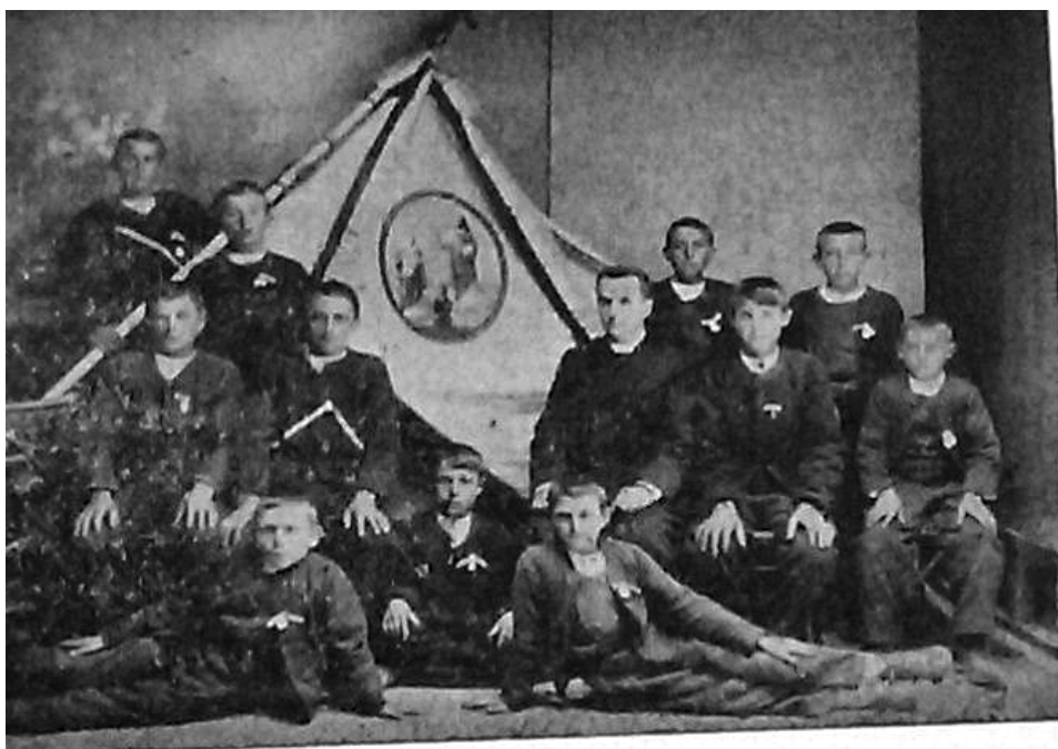
Slika 2. Mladenačko društvo u Slatinama (ilustracija preuzeta iz „Pravi hrvatski sokol“, Split 1912., br. 4, 5.)