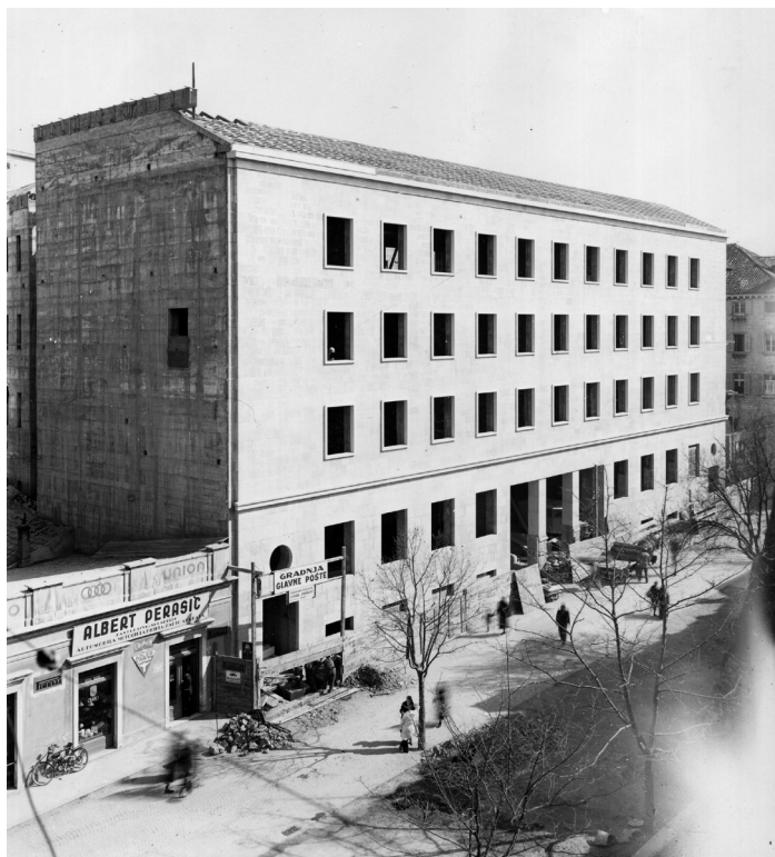
Slika 3. Zgrada Pošte, 1938.

Dana 20. svibnja 1936. pod predsjedanjem Kargotića održana je sjednica Općinskog vijeća s opširnim dnevnim redom. Raspravljalo se o općinskom budžetu za 1936./37. godinu. Predložen je iznos od 28.740.566 dinara. Kargotić je podnio ekspozice o tome. Smatrao je da se te godine zakasnilo s donošenjem, iako se trudilo. Do toga je došlo zbog redukcije činovničkih primanja po odredbi viših vlasti. Personalni rashodi trebali su se smanjiti do 1. listopada 1936. U pogledu vlastitih općinskih troškova osigurani su samo oni za pokriće javnih koji su u tijeku ili su uvjet za normalni promet i racionalnu izgradnju nekih predjela. Ipak, i pored svih restrikcija, Kargotić je smatrao da će se moći smanjiti djelatnost Općine, jer će se izvesti nekoliko javnih radova iz državnog budžeta. U debati je istaknuto da je u ovogodišnjem upravljanju napravljena ušteda u odnosu na prošlogodišnje. Bilo je primjedba da bi smanjivanje plaća gradskim činovnicima izazvalo velike poteškoće. To pitanje protezalo se od