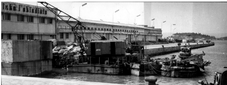
Slika 2. Carinska skladišta na Gatu sv. Duje, oko 1950.

dišta. To se počelo rješavati 1935. godine. Stoga je koncem ožujka Kargotić boravio više dana u Beogradu. Njegov posjet bio je u vezi s odobrenjem gradskog budžeta, izgradnjom carinskih skladišta u luci te drugim važnim pitanjima za grad. Posjetio je vodeće osobe državne i gospodarske politike. Primili su ga knez namjesnik Pavle, namjesnik Stamenković i dr. Perović, zatim ministar trgovine i industrije dr. Vrbančić te ministar financija dr. Stojadinović. 28