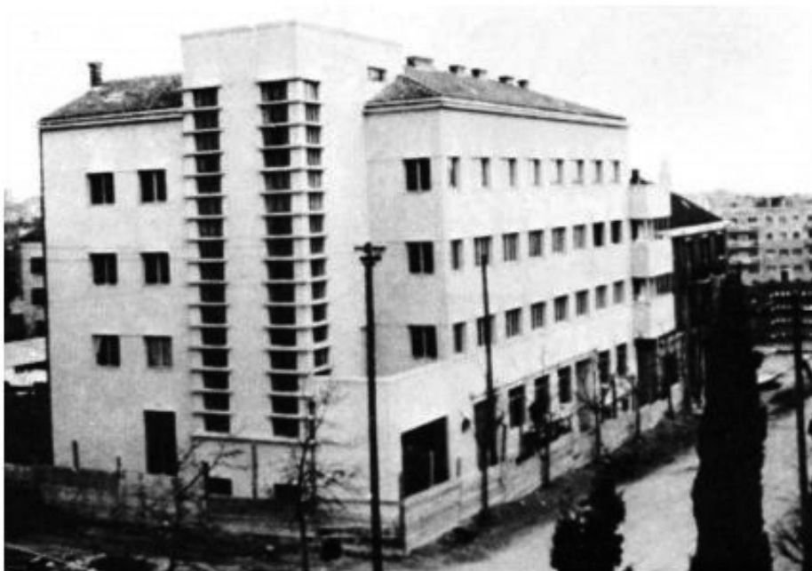
Slika 5. Burza rada u Zrinsko-frankopanskoj ulici. Projekt arhitekata Helena Baldasara i Emila Cicilijanija

širenje samostana svetog Dominika na Pazaru, gradnja Burze rada, carinskih skladišta, nove pošte, crkve Gospe od Zdravlja, hotela Ambasador , Bratimske blagajne na Bačvicama, te uređenje zapadne obale i druge.