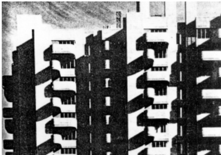
SL. 3. ZDANJE CRAWFORD, NEW HAVEN, SAD (P. RUDOLPH, 1962-66)