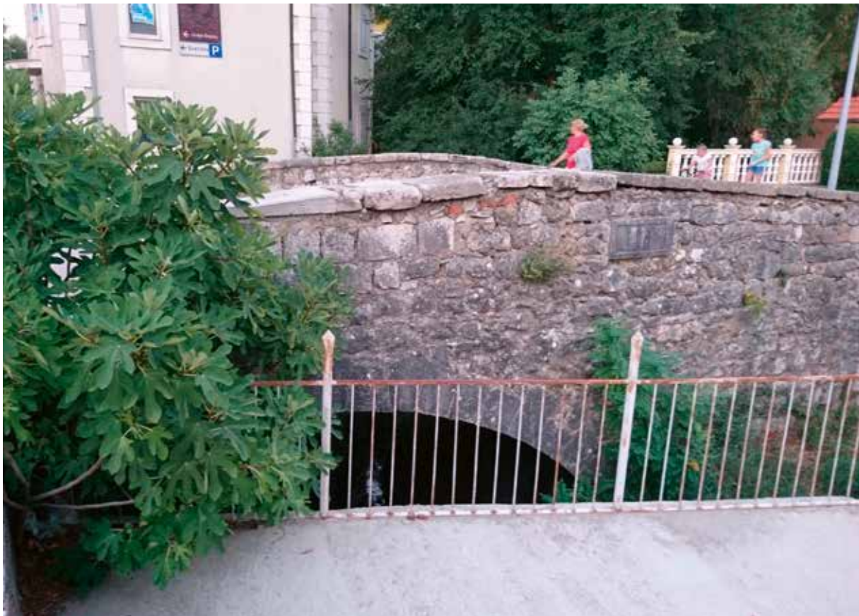
Slika 12: Veliki most na Gorući