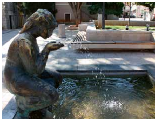
Slika 10: Na izvoru (Luca), autor kipar Stipe Sikirica

Zanimljivo je da je Vanja Radauš bio profesor mentor Stipi Sikirici na zagrebačkoj Akademiji, a obje skulpture, Radauševa i Sikiričina su postavljene iste, 1957. godine.