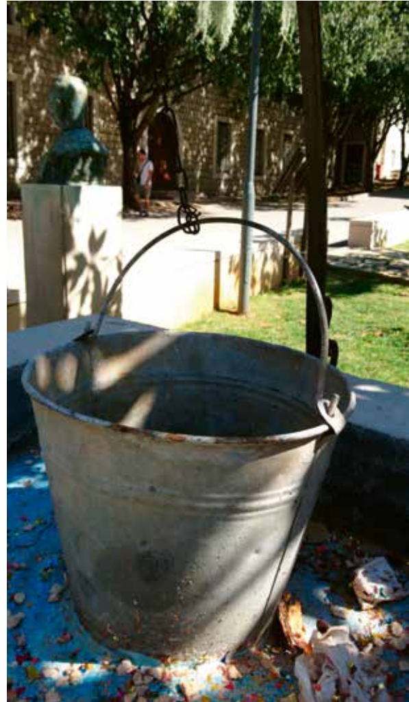
Slika 5: Po vodu na bunar (sić...)