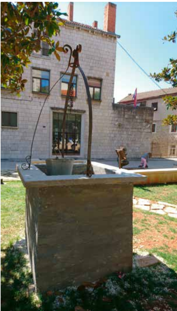
Slika 4: Replika nekadašnjeg bunara, dio instalacije Ašikovanje