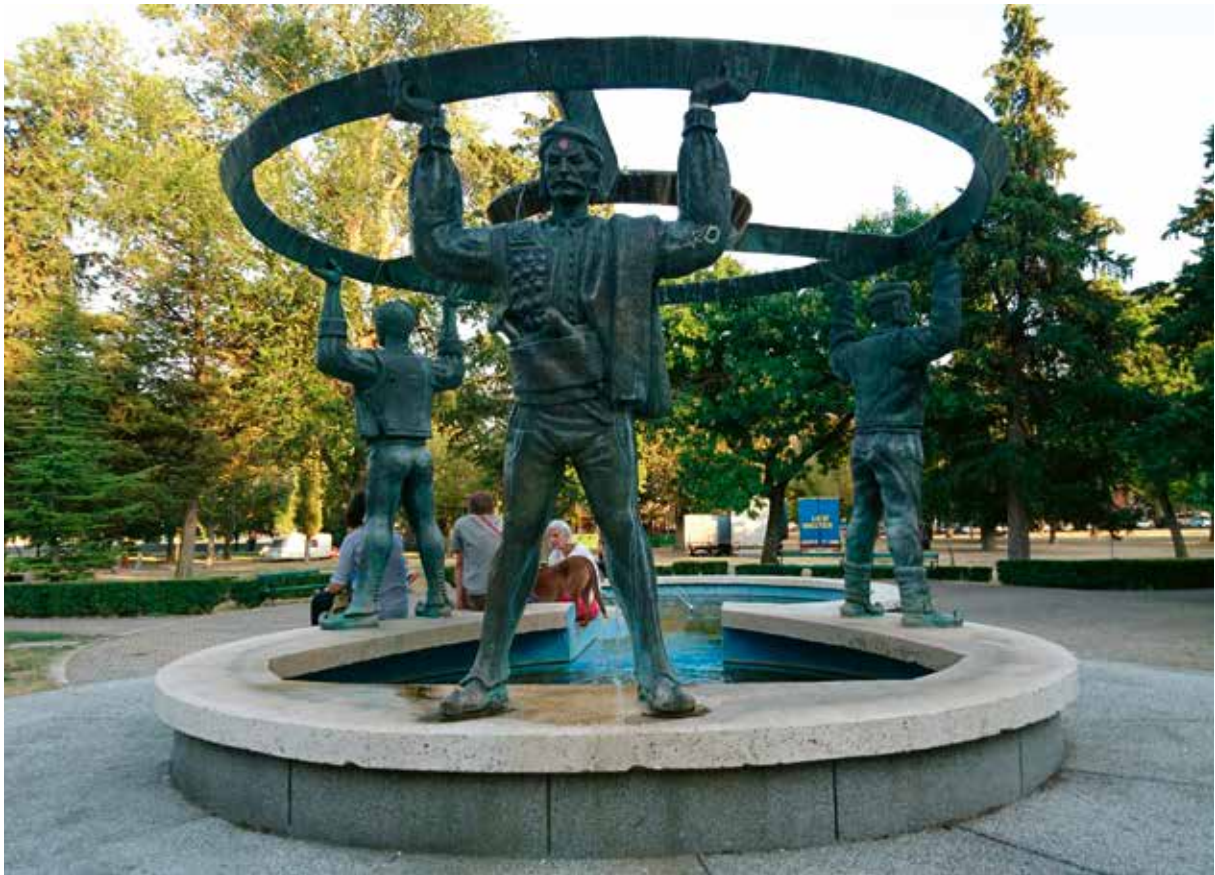
Slika 11: Spomenik s vodoskokom Tri generacije , autor kipar Ivo Filipović Grčić