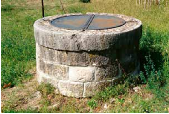
Slika 3: Nekada se po vodu išlo na bunar