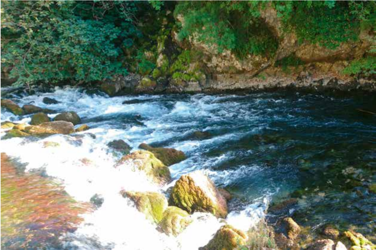
Slika 13: Uz Kosinac i Ruda opskrbljuje vodom Sinj i Trilj