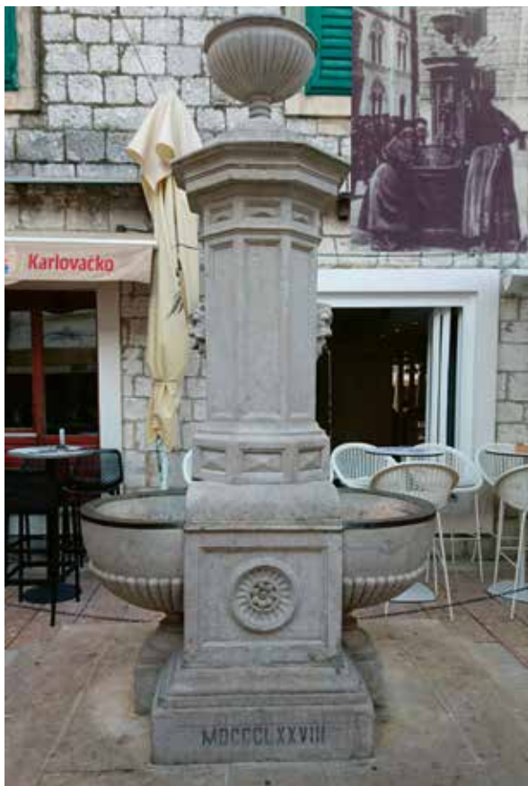
Slika 8: Fontana na Pijaci/Glavnom trgu

Po izvoru Odrina cijeli je taj zaselak dobio ime Odrina. U njemu su živjele siromašne obitelji, a glavni im je izvor prihoda bila prodaja zelja i povrća, kojeg su tu sadili i zalijevali vodom s Odrine. Svoje su proizvode svaki dan prodavali ispred tržnice. (Dalbello, 1996.)