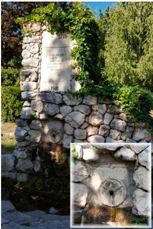
Slika 9: Špina u alkarskom duhu

Nekada su se mladi upoznavali i ašikovali na bunarima kamo su išli po vodu. Zanimljivu instalaciju pod nazivom Ašikovanje , udvaranje, koja se sastojala od dvije ljudske lutke, djevojke Anđe i mladića Frane, odjevene u tradicionalne narodne nošnje, a između