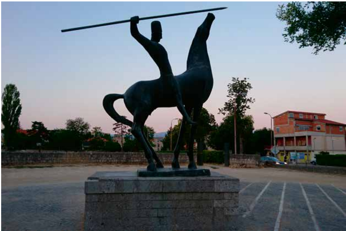
Slika 1: Spomenik alkaru, autor Stipe Skirica

Godine 1878. dovedena je voda s izvora Miletin pod kvartire i napravljena lijepa česma s dva izljeva, koju ljudi prozvaše Petrovac , u čast gospodinu Petru Tripalu,