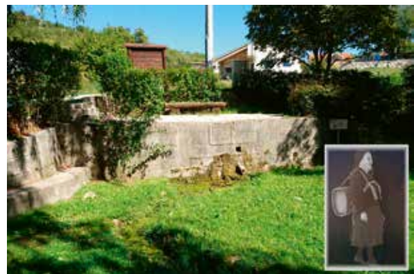
Slika 6: ... ili na izvor, ovdje Miletin (s vučijom)

Kačić Miošić, u spomen na veliku pobjedu Sinjana nad Osmanlijama.