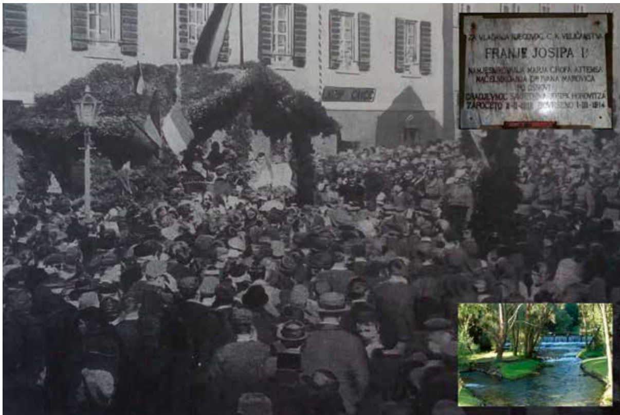
Slika 2: Otvorenje vodovoda s Kosinca (mala slika: Kosinac)

dugogodišnjem općinskom načelniku. Načelnici su tada služili besplatno, jer je to bila posebna čast.