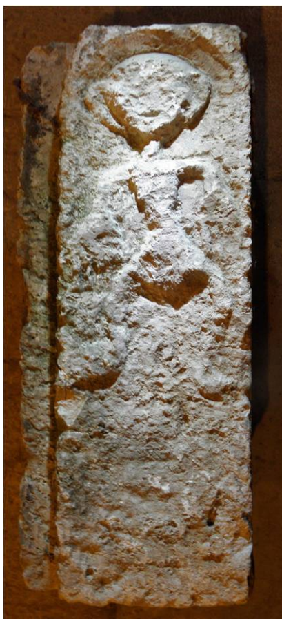
Sl. 1. Bale, reljef „Vanzemaljca“, vjerojatno 11. st.

hrvatskog prostora 20 . Ta vječna veza urbanih središta i ladanja najbolje je što imamo i to treba prepoznati i njegovati kao znak nacionalnog identiteta, a šansa kao i zadaća hrvatske humanistike je dalje otkrivanje, izučavanje i čuvanje tog velikog nacionalnog blaga. Izuzetni doprinos Radoslava Katičića stoji kao svjetionik na tom ne laganom ali plodonosnom putu.