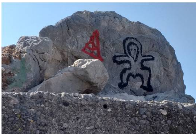
Sl. 2. Rijeka, Lukobran, „Vanzemaljac“, 2019.