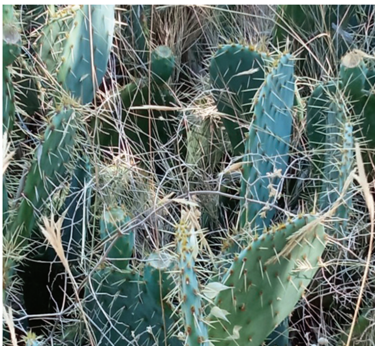
Slika 3. Opuncija-list