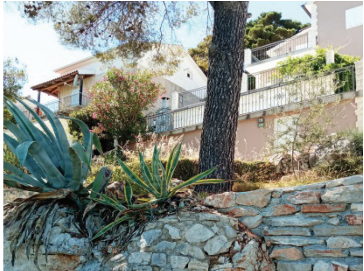
Slika 6. Različiti kultivari agave

Dakako biljka agava spominje se i u legendama, mitovima i predajama najstarijih latinskoameričkih civilizacija (Vučetić 2020). Jurković (1997) navodi da u školskom botaničkom vrtu u Kaštel Lukšiću rastu slijedeće vrste agava: Agave americana L. - obična agava (slika 6), Agave ferox C. Koch, Agave horrida Lem. ex Jacobi, Agave ingens Berger, Agave lophantha Schiede, Agave sisalana Perrine, Agave stricta Salm-Dyck. Grgurević (2009, 2017) preporuča s obzirom na otpornost na hladnoću pokušati saditi Agave parryi , A. potatorum , i A. ferox koje podnose temperature do -5°C. Nešto su manje rasta od obične agave.