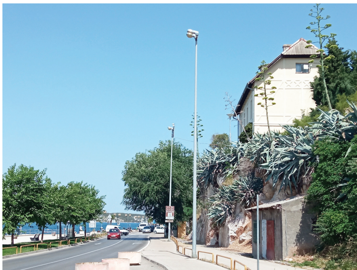
Slika 2. Agave pored šibenske obale