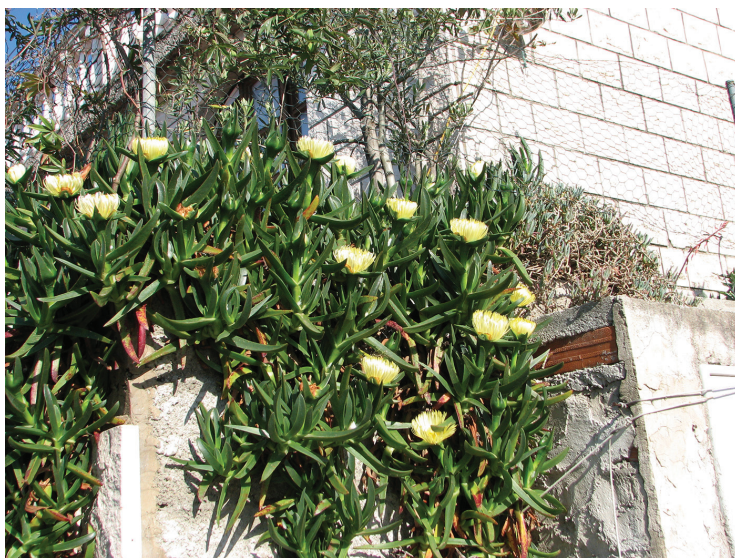
Slika 16. C. edulis