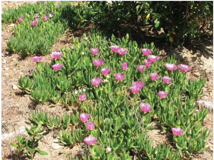
Slika 11. C. acinaciformis - cvijet

Vazdazeleni mesnatica, visine do 15 cm, koja se puzajućim stabljikama jastučasto širi. Listovi su nasuprotni, u parovima, djelomično srasli u bazi, u poprečnom presjeku trokutasti (trobridni), i malo svinuti u obliku sablje pa otud i latinski naziv acinaciformis – oblik sablje (Kovačić i dr. 2008; Vučetić 2020). Cvjetovi su mu prekrasni, ljubičastocrveni, koji se potkraj dana zatvaraju i potpuno otvaraju tek u podne slijedećeg dana. Zbog takvog „ponašanja“ sabljasti karpobrot netko je vrijeme pripadao rodu Mesembryanthemum – prema latinskom cvatemu u podne (Kovačić i dr. 2008; Vučetić 2020). Isti autor piše kako kažu da pažljivi promatrač po otvorenosti cvjetova može uskladiti i sat, ali dakako na lokalno podne (kad je Sunce na najvišoj točki na nebu). Cvijet oprašuju pčele i bumbari, pa se može često vidjeti bumbara kako uživa u cvijetu. Plod se razvija u rujnu mjesecu. Listovi su mesnati, trobridni (slike 11. i 12).