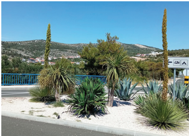
Slika 1. Različite sukulente na zelenim površinama

Cilj ovog rada je analizirati i komparirati biološke i ekološke karakteristike te šumsko-uzgojne značajke i primjenu u hortikulturi s posebnom osvrtom na pošumljavanje u cilju protupožarne zaštite.