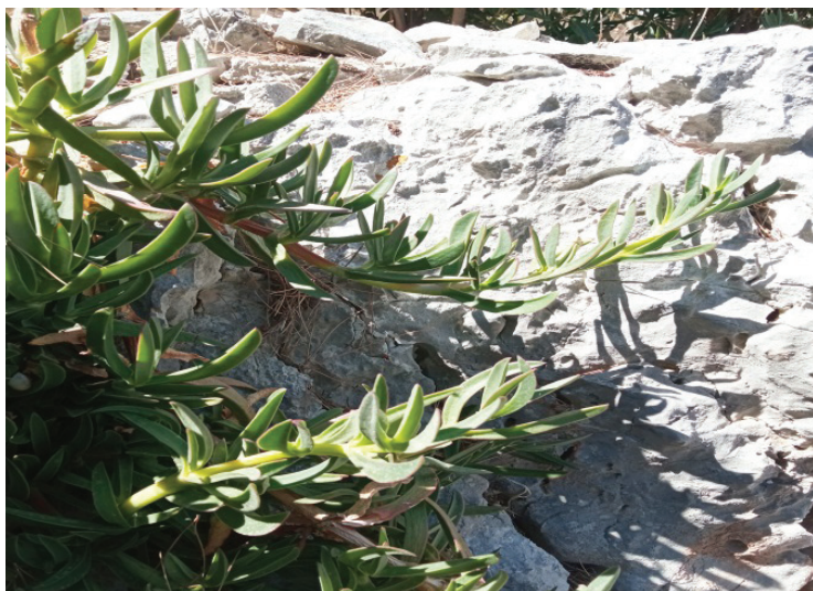
Slika 12. C. acinaciformis - list