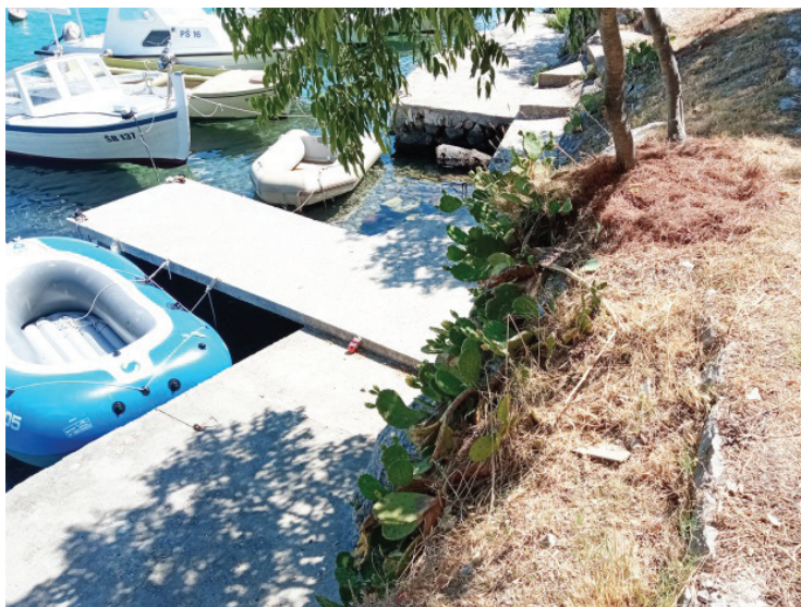
Slika 5. Opuncija sprječava eroziju

Marinković (1955) ističe da neki autori (npr. Agronom Zec 1940) navode da opuncija strada od studeni već od -3^{\circ}\text{C} do -4^{\circ}\text{C} , a kod -5^{\circ}\text{C} ili -6^{\circ}\text{C} potpuno ugiba. Međutim iskustva na terenu pokazuju i značajno drugačije rezultate, gdje je ova biljka podnijela i znatno niže temperature bez oštećenja npr. -8^{\circ}\text{C} do -9^{\circ}\text{C} na Braču. Na Rabu je opuncija preživjela i izuzetno hladnu zimu 1929. godine (Beltram 1954). Međutim u zimi 1934./35. godine mnoge biljke koje su prethodno pokusno sadene na otoku Rabu su propale od prevelike studeni „ osim njih stotinjak uz more ispod gradskog parka Komrčara prema zaljevu Sv. Eufemija. To je najtoplije i najzaštićenije mjesto na otoku Rabu “ (Premužić 1940).