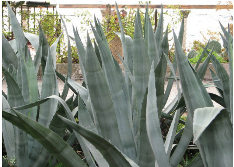
Slika 8. Agava-list

dugački, 3-djelni, na vrhu šiljasti, u početku zeleni, zatim smeđi i crnkasti tobolci pun brojnih sjemenki. Dozrijevaju tijekom zime. Nakon dozrijevanja uzdužno raspucavaju i oslobađaju sjemenke, koje su plosnate, polumjesečaste, crne, sjajne, 7-8 mm dugačke, 5-6 mm široke, anemohorne (Anić 1980; Kovačić i dr. 2008; Idžojtić 2013; Vučetić 2020) (slike 7. i 8).