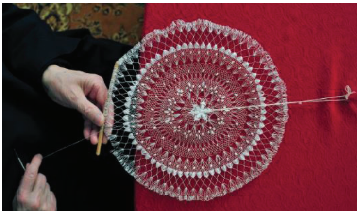
Slika 9. Hvarska čipka od agavinih vlakana ( https://visithvar.hr/hr/see-and-do/hvarska-cipka/ )