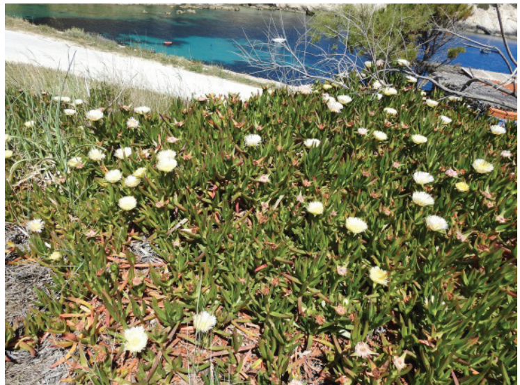
Slika 15. C. edulis na obali

C. edulis , porijeklom je iz Južne Afrike te je jedna od značajnijih invazivnih vrsta u mediteranskim obalnim ekosustavima diljem svijeta. Njegova invazija ima velik utjecaj na obalna staništa. Prema nekim istraživanjima mali broj autohtonih vrsta ukazuje na moguće postojanje mehanizama za suzbijanje klijavosti hotentotske ruže (Novoa i dr. 2012). Ova vrsta je početkom 20. stoljeća uvedena u Kaliforniju sa svrhom stabilizacije tla uz željezničke pruge, a kasnije je sađena i uz autoceste te korištena za stabiliziranje obalnih pješčanih dina (Albert 1995., prema, Conser i Connor 2009). Vrsta snižava pH tla i povećava organski sadržaj u tlu što se možda razvilo kao novi mehanizam pri invaziji i zauzimanju pogodnih zemljišta (Conser i Connor 2009). Na nekim nepogodnim, lokaliziranim i aridnim terenima bi ju bilo pogodno saditi i kod nas u cilju vatrozaštite i smanjenje erozije tla (slike 15. i 16).