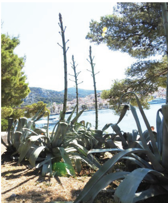
Slika 7. Agava-cvijet

Stabljike gotovo nema. Lišće je do 1-1,5 (2) m dugo i do 15-20 (30) cm široko, debelo, sočno, sivozeleno, prema gore blago savinuto, po obodu trnasto nazubljeno s vršnim, 2-3 cm dugim, oštrim smeđastim trnom. Listovi, njih 30-40, tvore snažnu rozetu. Početak cvjetanja, rast batva, počinje već u svibnju i polako odumire cijelo ljeto. Cvjetno batvo može biti 5-8 (12) m visoko. Na vrhu je velika uspravna cvjetna metlica (cvat), piramidalnog oblika sa 25-30 (15-35) horizontalnih ogranaka, i do 14000 cvjetova. Cvjetovi su veliki, do 7-9 cm dugački, uski, uspravni, kitnjasti na krajevima vodoravnih grana, zelenkastožuti, ugodna mirisa. Imaju 6 prašnika i 1 tučak s glavičastom i trolapom njuškom. Cvjetovi su dvospolni, entomofilni. Cvatnja se odvija od lipnja do kolovoza. Do cvjetanja joj je potrebno katkad 10, 15, 20 i 50 godina, katkad čak 100 godina. Sve ovisi o uvjetima u kojima agava živi. U prirodnoj postojbini, Meksiku najranije, u starosti 8-10 godina. Voli obilje sunca, topline i svjetla. Nakon cvjetanja matična biljka uvene, ali se odmah vegetativno obnavlja iz korijenskih izdanaka. Ugibanje agave može se spriječiti razanjem cvjetnog batva prije nego se razvije cvijet. Plod je duguljast tobolac, uspravni, višesjemeni, 4-5 (-8)