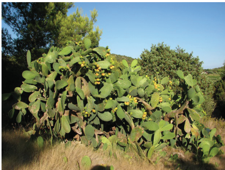
Slika 4. Opuncija-habitus