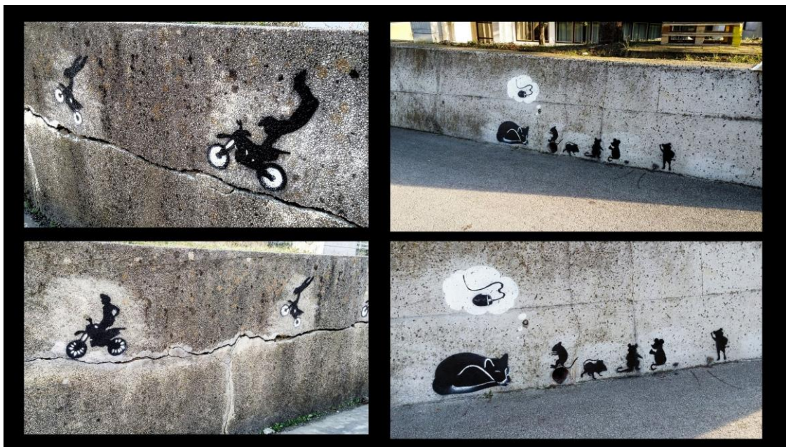
Slika 2: Motoristi, Mačka i miševi