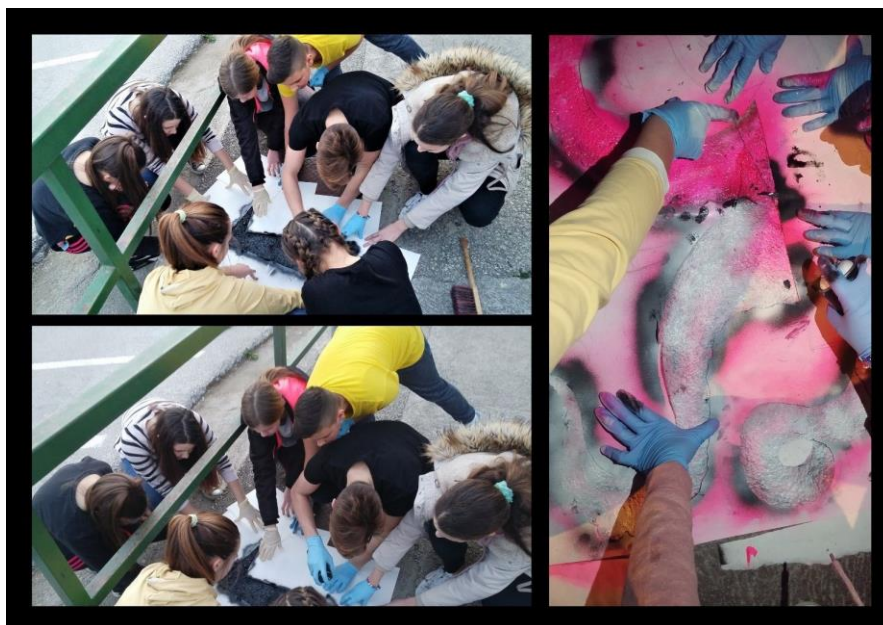
Slika 4: Tijek rada na Hobotnici

On nam je uz puno povjerenje dao dozvolu za naše kreacije. Sljedeći projekt nazvali smo „Hobotnica“, naime naslikali su ružičastu hobotnicu koja izlazi iz šahta. Ovdje su učenici dali sve od sebe. Prvo su pripremili šablone za tri boje, a zatim na terenu izveli rad.