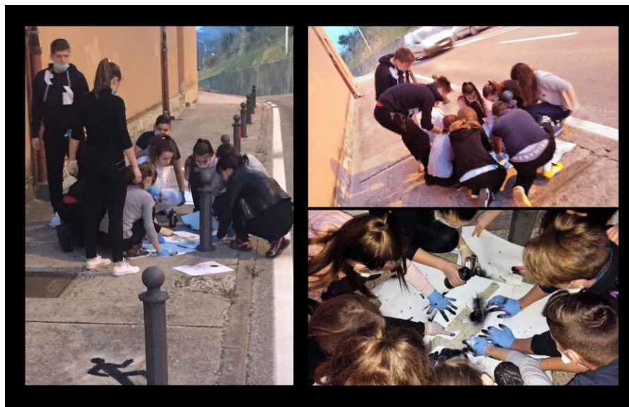
Slika 6: Pripreme i tijek rada

Drugi složeniji projekt nazvali smo „Bijeg“. Izveli smo ga na nogostupu koji ima ugrađene zaštitne metalne stupiće. Za svaki stupić zamislili su da ima sjenu koja se postepeno pretvara u siluetu čovjeka. Silueta se iz ukočenog stava, zarobljena uz tijelo stupa, polako pretvara u čovjeka koji pokušava pobjeći. Na taj način prolaznik može pratiti „bijeg“ sjene stupića u nizu.