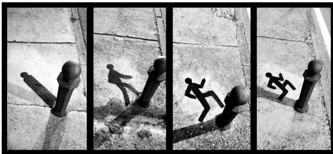
Slika 7: Bijeg

Ovaj smo projekt dodatno iskoristili za izradu kratkog videa u stop animaciji, koji jasnije opisuje zadanu temu.