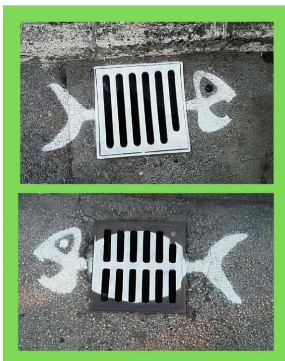
Slika 3: Ribice

Učenici su stekli iskustvo, pa smo krenuli na složenije zadatke. Za ovu i sljedeće intervencije obratila sam se našem gradonačelniku za dozvolu. Opisala sam mu ukratko što bi sve izveli i navela mjesta u gradu gdje planiramo intervenirati. Objasnila sam da slike neće biti invazivne za okolinu, već diskretne.