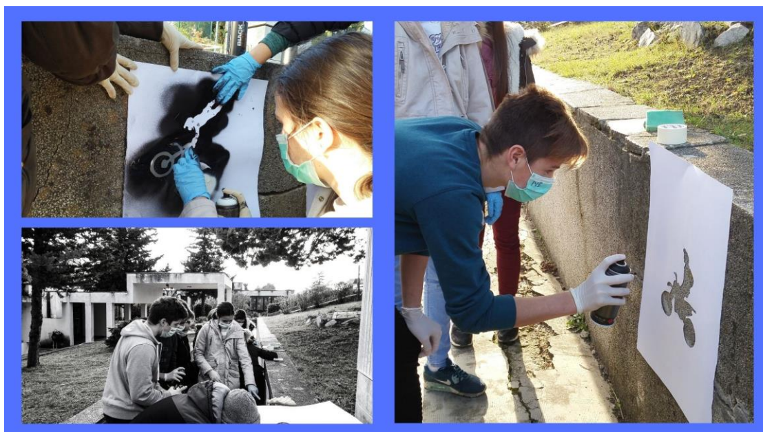
Slika 1: Pripreme i tijek rada

Prve grafite izveli smo na zidovima u školskom dvorištu. Radili su ih u dvije boje (crna i bijela). Za svaku boju bilo je potrebno izraditi posebnu šablonu. Evo nekoliko primjera naših prvih intervencija.