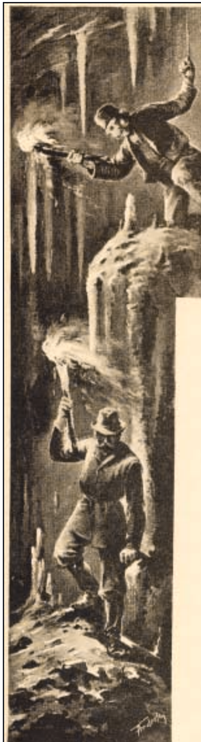
Najstariji prikaz speleološkog istraživanja u Hrvatskoj, objavljen 1898., crtež Vaclava Anderlea

Iz njegove bibliografije može se ustanoviti da je mnogo putovao po cijeloj Hrvatskoj, ali i po susjednim zemljama. Opisao je gotovo detaljno Gorski kotar, Liku, Hrvatsko primorje, Dalmaciju s otocima i Slavoniju, ali je vrlo malo pisao o Vele-