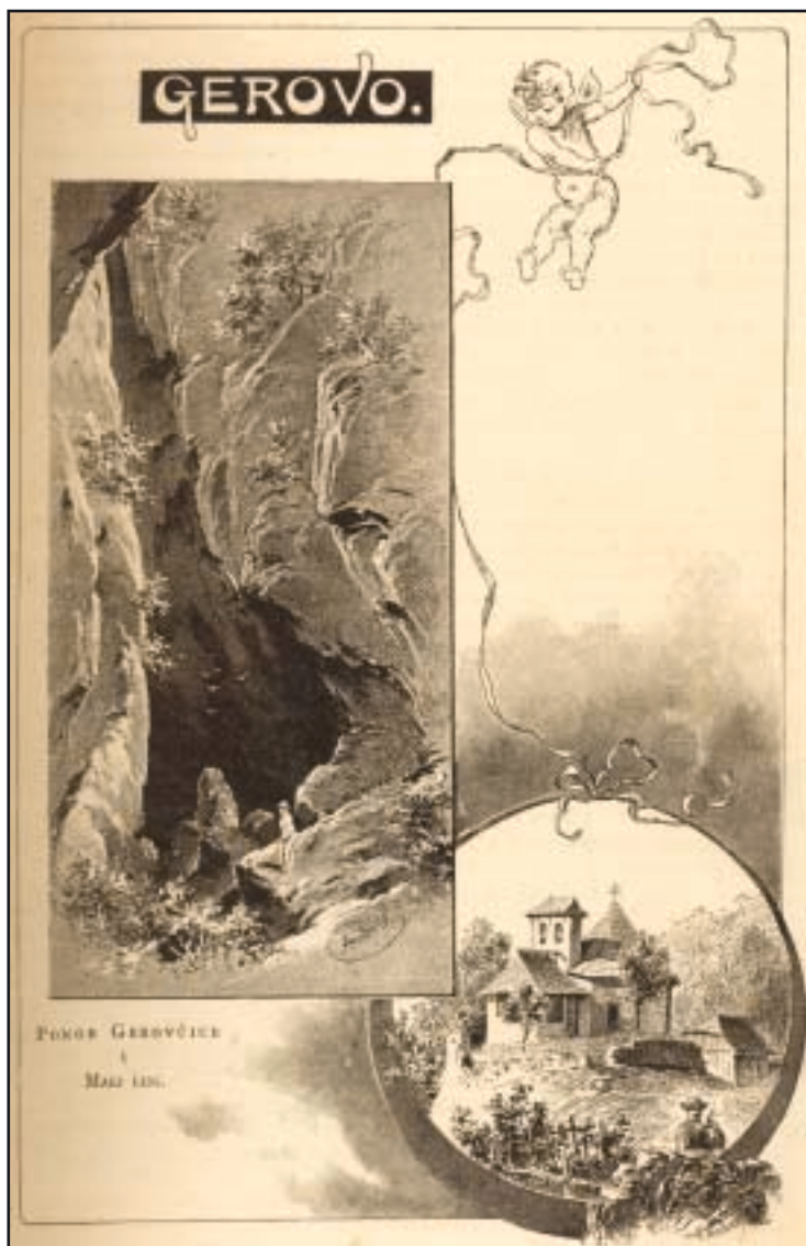
Ponor Gerovčice - crtež Vaclava Anderla iz knjige »Gorski kotar«