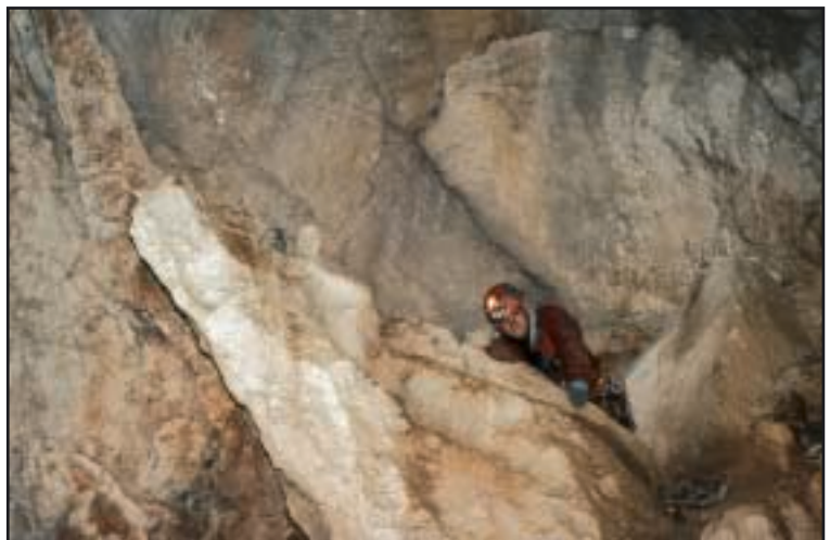
Prolaz na boku dvorane »Doma na propuhu« (–140 m) kroz koji se ulazi u donji dio jame

Ulazna vertikalna je 33 m, slijedi kosina od 20 m i tu se do špiljskog ulaza od 10×5 m spustite još 5 m. Sada dolazite u dvoranu »Lazu«, koja je 20×25 m. U dvorani, u smjeru zapada, dolazi se do malog penjanja od 3 m. Gore je kršljivo, pa se prvo sidrište