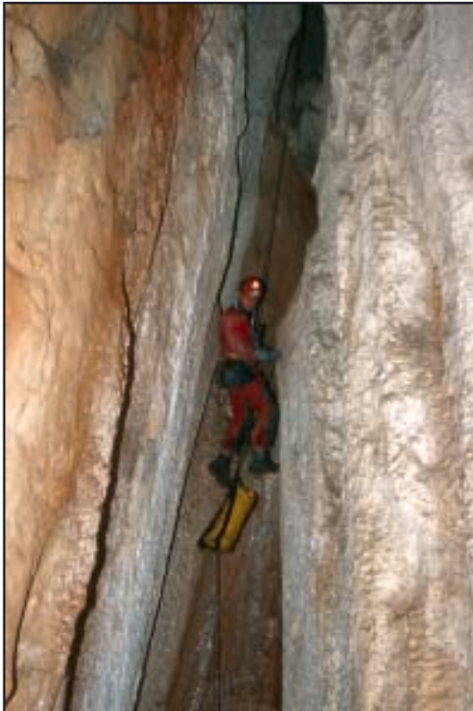
Donji dio vertikale na ulazu u dvoranu »Doma na propuhu«

veže oko jedinog stabilnog kamena. Nakon 3 m je prvi spit, kojim se spušta do prve police, koja nije preporučljiva za okupljanje. Drugi je spit (sidrište) na polici. Odande se ide dalje vertikalom 15 m do ulaza u »Dvoranu 4 soma razbojnika« ili produžava još 14 m do kanala »Bivši slap«. U »Dvorani 4 soma razbojnika« pod kutom od 330 stupnjeva nalazi se