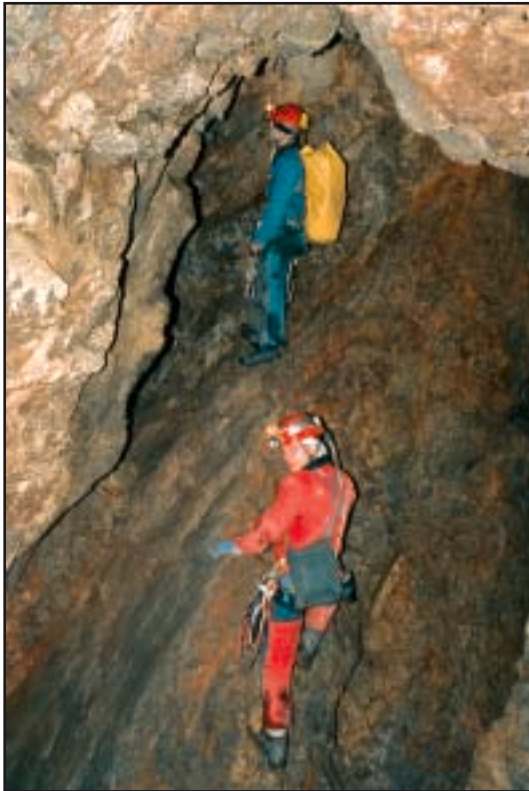
Prolaz iz ulazne dvorane prema nastavku jame

dno«. Dado se muči s otkopavanjem rupice, no bezuspješno. Kroz nju baca kamen i on se ronda dvadesetak metara. Nažalost, ne možemo za njim. Nakon izlaska slušamo izvještaj druge ekipe: njihova je perspektiva završila nakon 7 metara.