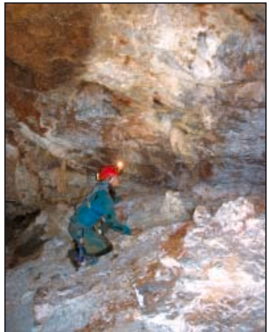
Sige u suhom dijelu dvorane »Četiri soma razbojnika«