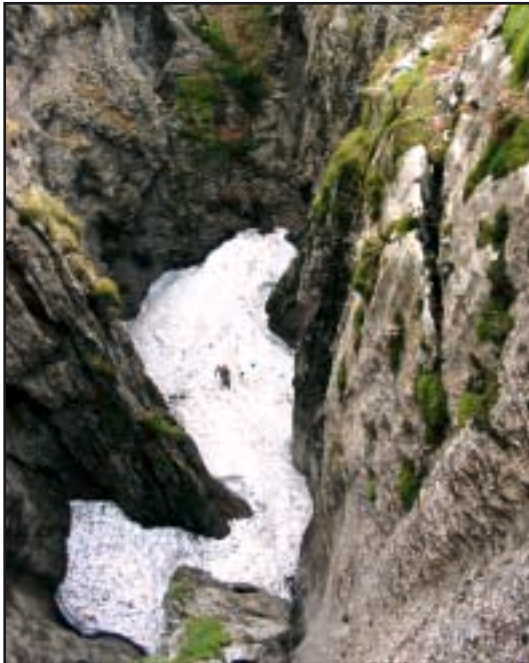
Snijegom prekriveno dno ulaznog dijela jame