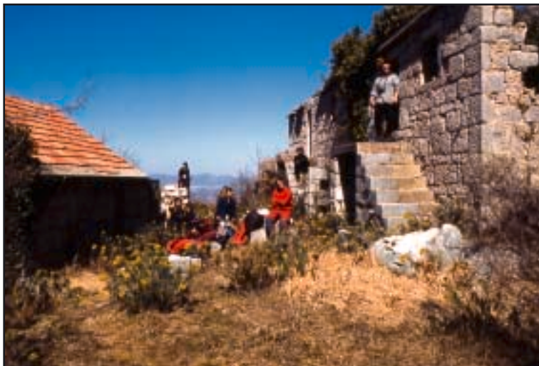
Ekipa istraživača u zaselku Drinovi