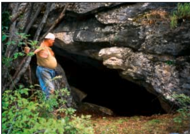
Ulaz u špilju Drinova II