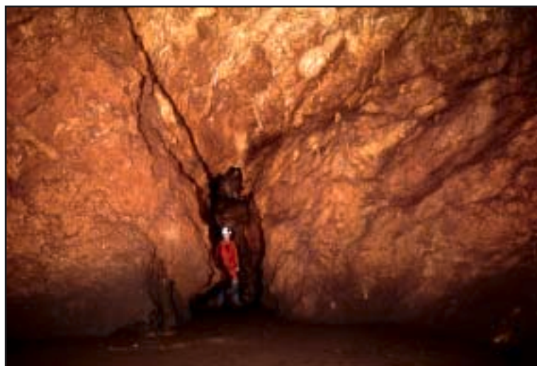
Na kraju špilje

Ulaznu dvoranu od špiljskoga kanala dijeli velik kameni blok. Dno ulazne dvorane je strm kameni sipar koji se nastavlja i podno uglavljenog kamenog bloka. Provlačenjem između bloka i bočne stijene dolazi se u prostrani špiljski kanal. Nakon sipara slijedi prostrani horizontalni špiljski kanal. Dno kanala prekriveno je zemljanim nanosom. Bokovi kanala bogato su ukrašeni sigastim tvore-