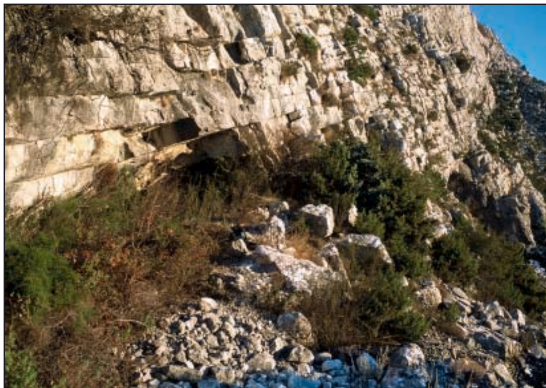
Pripećak ispred ulaza u Malu špilju (ulaz je u njegovu desnom kraju); ulaz u Velu špilju vidljiv je krajnje desno

U istom nam članku Gilić daje naslutiti o kakvoj se vrsti blaga moglo raditi: u »Velikoj peći« mogu se naći keramika i životinjske kosti, a nalazi iz »Male peći« još su zanimljiviji. U »sve tri« njezine dvorane ima keramike, životinjskih i ljudskih kostiju. U zadnjoj dvorani pronađena je jedna cijela ljudska lubanja. Djeca su ondje kasnije pronašla i brončanu šuplju sjekiru koja je završila u splitskom arheološkom muzeju.