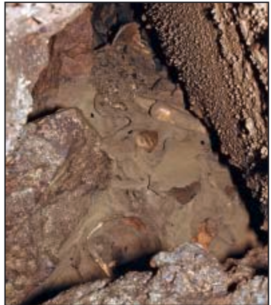
Ulomci lončarije i ljudskih kostiju u završnoj dvorani špilje

Iza 1,5 m visoke stube, sljedećih 30 m hodnika nastavlja se u vidu uske pukotine, mjestimice niže od metra i uže od pola metra. Tim dijelom špilje protječu vode cjednice koje se skupljaju u nekoliko manjih bazena i kaskada. Završni se dio špilje sastoji od dvorane nepravilna oblika, veličine 30×10×7 m.