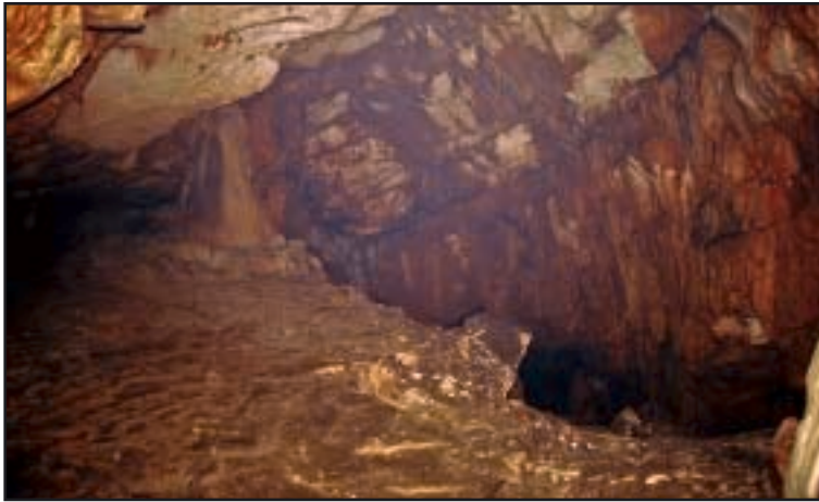
Zaravanak u prednjem dijelu završne dvorane