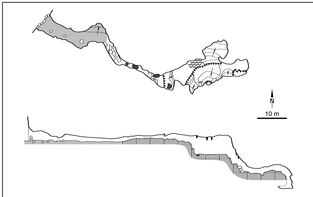
Tlocrt i presjek Male špilje kod Kozice (J. Posarić i B. Jalžić)

U nju se ulazi niz sigasti saljev visok oko 3 m, ispod kojeg je bazenčić s vodom. Višak vode iz tog bazenčića prelijeva se kroz kratak, vrlo uzak i blatan bočni kanal koji završava vertikalnim skokom od 6 m. Na njegovu je dnu pronađeno nekoliko jako zasiganih ljudskih kostiju, mnogo ulomaka lončarije i jedna cijela, posve zasigana šalica s visokom ručkom.