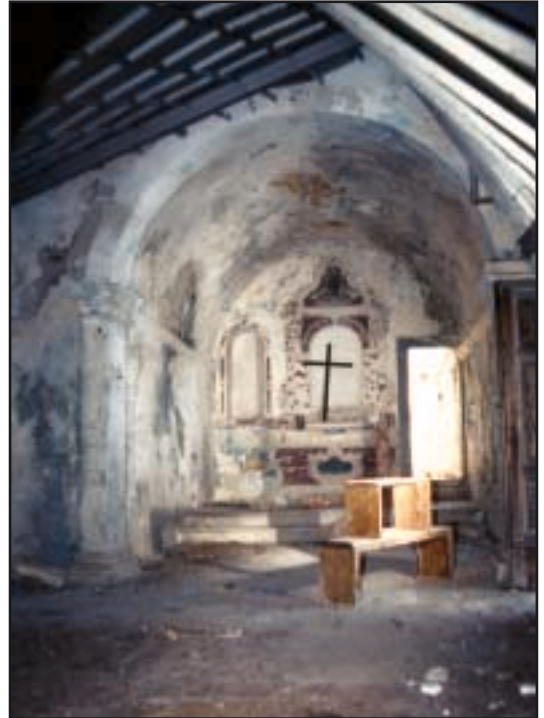
Unutrašnjost kapelice (pogled prema istoku)

špilji i načinjen je preliv viška vode iz bazena u cisternu ispred špilje. U samostanu je svojevremeno živjelo mnogo ljudi, sve do 1945. kada je samostan spaljen. Od tada je samostan napušten. Ostali su samo kameni zidovi koji se vide iz daljine. Dio samostana u špilji – kapelica i bazen s vodom – i danas su u razmjerno dobrom stanju pa ih često posjećuju turisti iz Murvice.