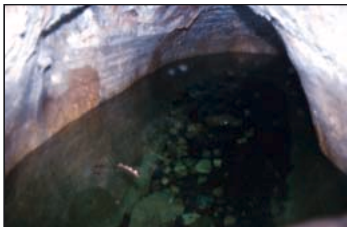
Bazen s vodom

Budući da strop nije ožbukani, sa stropa je u kapelicu stalno kapala voda, pa je bila postavljena posebna metalna stropna konstrukcija koja je vodu odvodila u žlijeb uz