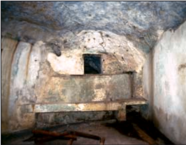
Unutrašnjost kapelice (pogled prema brani i bazenu vode)

Iz te knjige doznajemo da je prvo bila zaposjednuta Zmajeva špilja, još 1460., kada su na južnu obalu otoka Brača došli prebjezi – monasi glagoljaši iz samostana u Poljicama kraj Splita, bježeći pred Turcima. Pola stoljeća poslije, tj. 1511. ili 1520., zaposjednuta je i špilja Dračeva Luka. Naziv je dobila po Dračevoj uvali iznad koje se nalazi špilja (Drak = dragon = zmaj). Prvi je stanovnik špilje Dračeve Luke bio Marin Kapetanović, za koga Valerio kaže da je bio splitski svećenik, iako se možda radi o poljičkom glagoljašu koji je pripadao splitskoj biskupiji. Zajedno s drugim pridošlicama i u ovoj špilji je osnovan pustinjački samostan. Nedugo su zatim, 1555. dvojica svećenika došla u špilju Ljubitovicu i u njoj osnovala samostan,