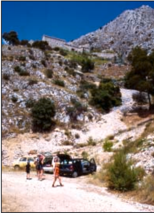
Pogled na ruševine samostana