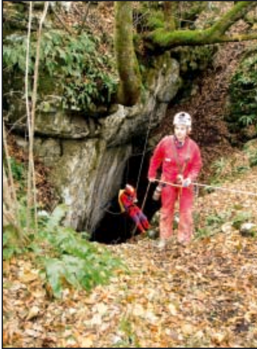
Silazak u Jopićeveu špilju

pota špilje. Bilo je 12 kontrolnih točaka, a nalazile su se posvuda u špilji i na različitim razinama, što nam je nekoliko puta prilično otežalo njihovo pronalaženje. Krenuli smo lagano, uz »detaljno« pregleđavanje terena, a nakon pola sata pridružila nam se ekipa iz Kastva, pa smo ostatak vremena proveli zajedno tražeći točke. Nekoliko nas je točaka pošteno namučilo, a najneuhvatljivija nam je bila točka br. 7, koju smo tražili oko sat i pol. Ispostavilo se da smo dva put stajali ispod nje, ali je nismo mogli vidjeti. Nakon iscrpne potrage, uspjeli smo pronaći usku pukotinu u stijeni i kroz nju se popeti na gornju razinu, u kojoj smo pronašli točku. Na kraju nam je pošlo za rukom pronaći sve kontrolne točke, i to nakon što smo se dva puta izvrtjeli oko Šišmiševe dvorane i skrenuli u krivi kanal na samom izlazu. Za to nam je trebalo 7 i pol sati, što je nama bilo dovoljno da osvojimo 3. mjesto, a ekipi iz Kastva 4. mjesto. Prvo mjesto osvojila je ekipa iz Karlovca.