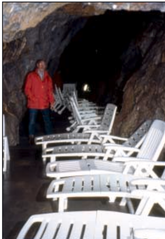
Ležaljke za speleoterapiju u kanalu Ostrovske špilje

Špilje su iznova uređene 1997. tako što su staze kroz špilje izrađene od hrapavog betona (da ne bi bilo poskliznuća), a mostići, ograde i rukohvati od rešetkastog nehrđajućeg lima. Staze su izvedene tako da se posjetitelji nigdje ne može zamazati.