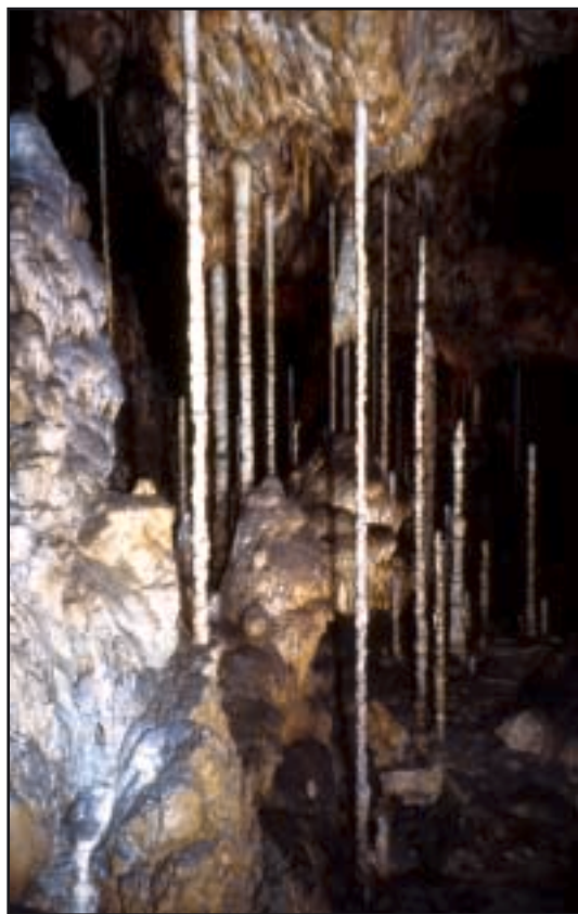
Tanki stalagmiti u Katerinskoj špilji