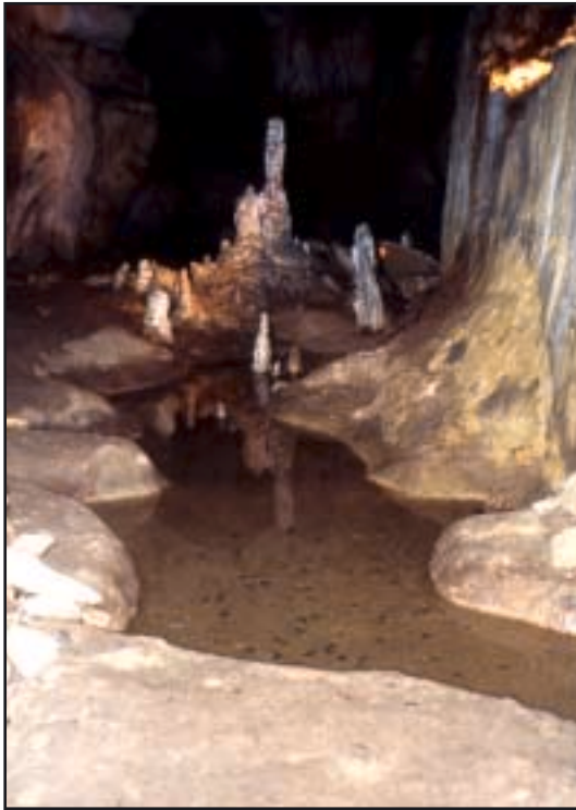
»Jezero želja« u špilji Balcarki