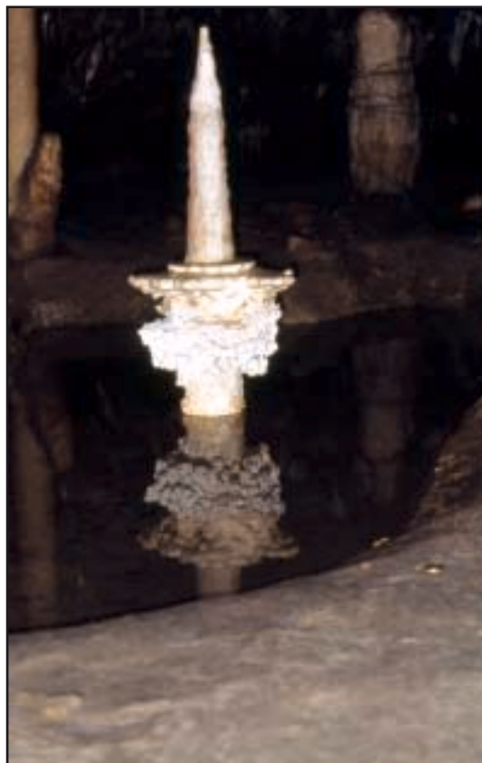
»Sviječnjak« u Sloupsko-Šošuvskim špiljama

Sudjelovali su predstavnici iz Švicarske (1), Austrije (3), Engleske (2), Nizozemske (1), Mađarske (3), Slovačke (4), Slovenije (4), Hrvatske (1) i Češke (8), ukupno 27. Održano je 16 predavanja. Ja sam održao predavanje o pustinjačkim špiljama na otoku Braču. Bile su upriličene ekscurzije u obližnje špilje važne za povijest speleologije u Češkoj.