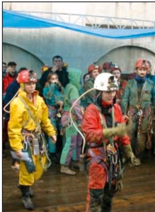
Pod kišobranima u Ogulinu