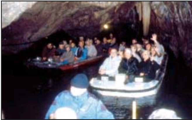
Vožnja čamcima podzemnim dijelom Punkve