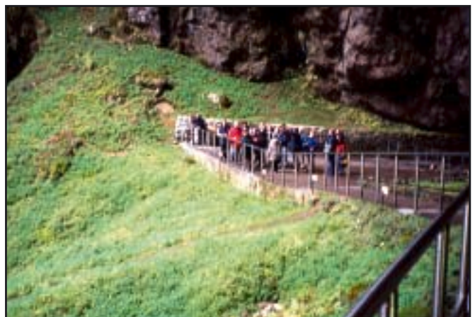
Vidikovac na dnu jame Macoche