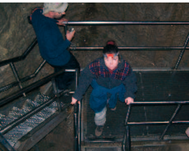
Stube za silaz u niže dijelove špilje na turi »Smrznuta Niagara«