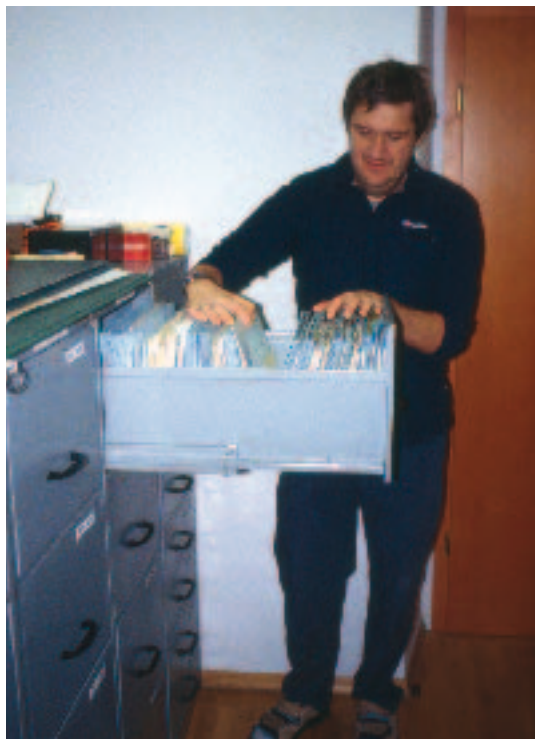
Katastar slovenskih speleoloških objekata