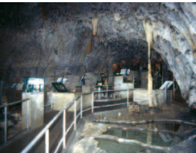
Vivarij - muzej špiljskih životinja

Sljedeća postaja bio je Institut, gdje su nas dočekali širom otvorenih ruku. Saslušavši predavanje o povijesti istraživanja krša (kako u Sloveniji tako i izvan nje), te prošlim, sadašnjim i budućim projektima Instituta, povelu su nas u razgledavanje novo obnovljene zgrade. Najviše nas se dojmio katastar špilja i jama Slovenije koji se nalazi u njihovim prostorijama. Miha Čekada, glavni i odgovorni za njegovo održavanje, objasnio nam je da mu je namjena vođenje evidencije špiljskih objekata, kao i aktivnosti špiljarskih društava u Sloveniji. Na katastru se sustavno radi već dugi niz godina u bliskoj suradnji s JZS - om (Jamarska zveza Slovenije). Sam pogled na slovenski katastar započeo je bolnu diskusiju o pokretanju, odnosno ujedinjavanju postojećih raspršenih po-