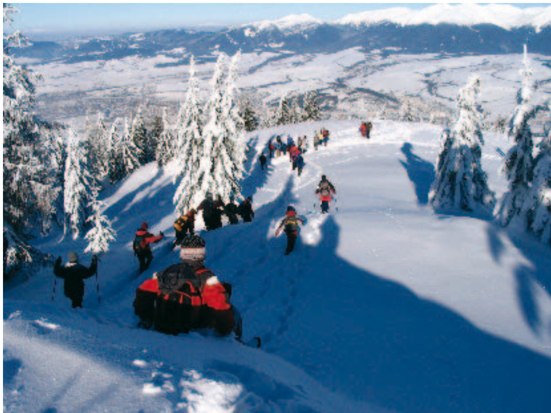
Povratak s vrha Poludnice