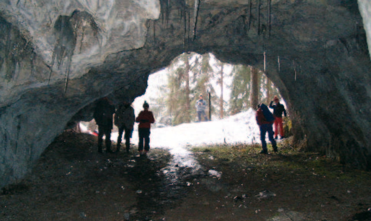
Ulaz u Veliku Stanišovsku špilju