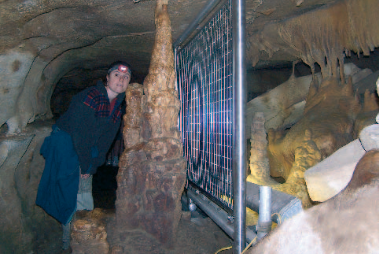
Način zaštite siga na turi »Smrznuta Niagara«