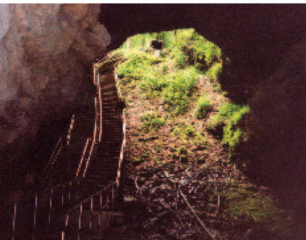
Prirodni ulaz u Mammoth cave