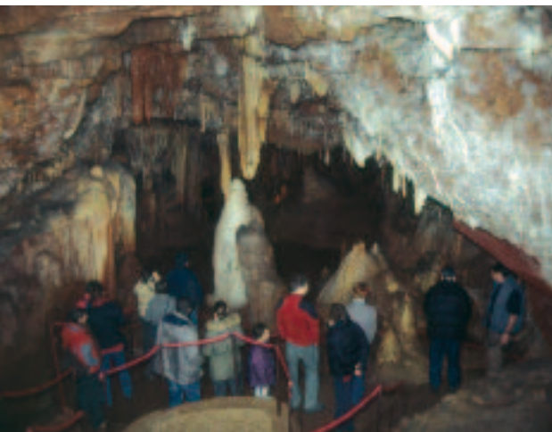
Na kraju turističkog puta u špilji Baredine