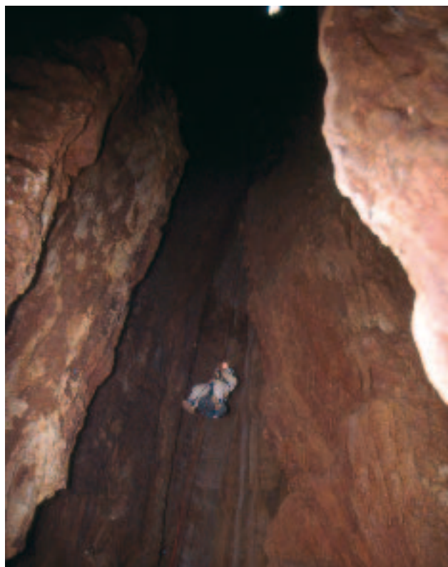
Spuštanje u Škrabićevu jamu

Prošlo je dva sata od kako su se rastali. S opremom s kojom su tada raspolagali do njege nisu mogli. Izašli su iz jame, odjurili kući po još opreme (užeta i karabinere), obavijestili ro-