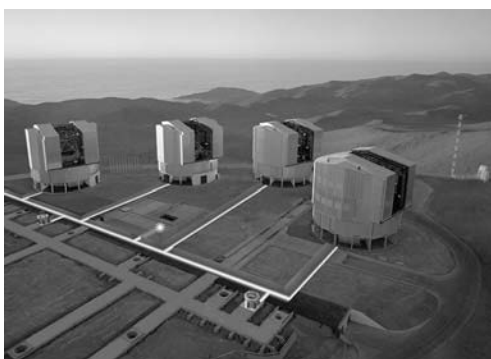
Very Large Telescope, Paranal, Čile.

Najveća prepreka toliko velikim teleskopima za postizanje potrebne oštine je atmosfera na Zemlji koja uzrokuje izobličenja slike. Jedna od prvih tehnika korištenih za poboljšanje rezolucije bazirala se na tome da se umjesto jednog dugog perioda snimanja (ekspozicije) koristi više kratkih koji se međusobno kombiniraju uz korekciju pomaka. Time se eliminiraju deformacije slike koje nastaju zbog gibanja masa zraka u atmosferi. Nadalje, razvoj tzv. adaptivne optike u teleskopima omogućio je postizanje dovoljne preciznosti da se sitni pomaci zvijezda mogu razaznati. Daljnji razvoj tehnika omogućio je poboljšanje rezolucije od ukupno 1000 puta kroz period od 30-tak godina u kojem se pratilo zvijezde. Za više detalja pogledati [2].