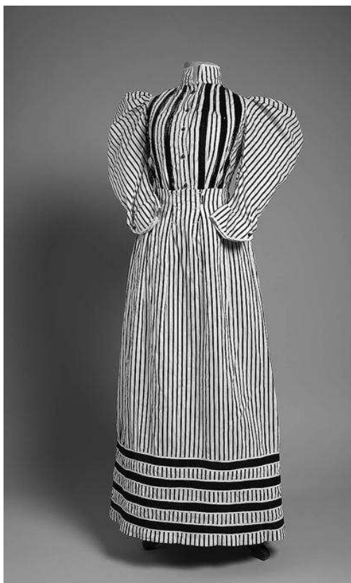
sl.11. Dnevna haljina, Caroline Hummel Wien I, Beč, 1906.

Osim poslom, moderna se žena na prijelazu iz 19. u 20. stoljeće bavi i sportskim aktivnostima. Za tenis je nosila bijelu dvodijelnu haljinu (MUO 18265/1, 2; sl. 9.) od pamučnog ripsa, čija se suknja u donjem dijelu blago širila, a bluza je imala poluduge rukave. Haljina je bila jednostavna i udobna, a sezala je do gležnjeva. Žene je od sunca štitiio pleteni šešir od slame – girardi (MUO 9798), i po tipu je pripadao muškim šeširima. Sportske cipele (MUO 18271/1, 2) bile su gležnjače na vezanje, izrađene od jelenske kože bijele boje. Nakon neuspješnog pokušaja nošenja sportskih hlača u doba historicizma, ovaj put to postaje društveno prihvatljivo. Pumperice crne boje, izrađene od plisirane svile i bogato nabrane (MUO 18262 i MUO 23984; sl. 10.), omogućile su ženama veću slobodu kretanja.