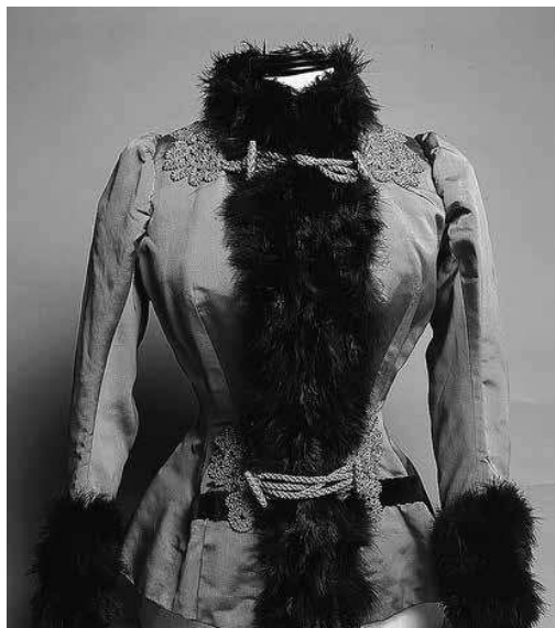
sl.6. Haljetak, Hrvatska, 1885. MUO 9393