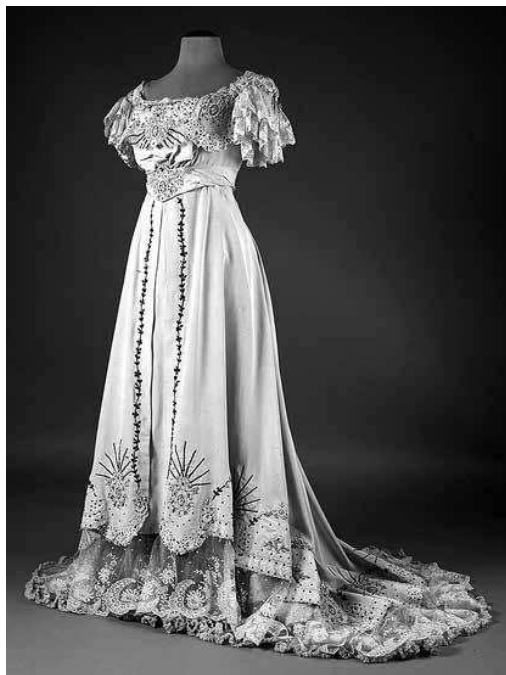
sl.13. Plesna haljina, Maison Caroline Hummel Wien, Beč, 1906.-1907. MUO-11596/1,2

Na kraju dana plesni su podiji bili važna društvena okupljališta. Dame su se pripremale za izlazak dotjerujući kosu bren-škarama s ručkama od bjelokosti (MUO 18275/1 i MUO 18275/2), a da bi zagrijale škare, koristile su se metalnim grijalom (MUO 18276) smještenim u kožnoj kutijici. Potom je slijedilo, primjerice, oblačenje dvodijelne haljine od svjetloplavog ripsa (MUO 11596/1, 2; sl. 13.), bogato ukrašene naborima čipke na prsima i na donjem rubu haljine. Suknja je zvonolikog oblika i prema dnu se jako širi, a sa stražnje strane prelazi u povlaku. Proizvođač haljine je modna kuća Caroline Hummel. Za potpuni dojam žene su nosile visoke rukavice (MUO 13411/2) od bijele jelenske kože sa sedefnim gumbima na zglobovima. I, za kraj, još nekoliko kapi poznatog parfema Coty de Cologne (MUO 42371).