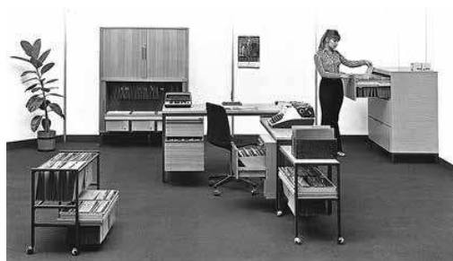
PAN PROGRAM SASTAV 6

PAN-QUICK na različitim kombinacijama s različitim pločama u grupnim i pojedinačnim radnim prostorima. Transponirani priključci na najuži red