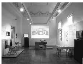
sl.1. Pogled na postav izložbe Bernardo Bernardi i TVIN: Od komponibilnog sistema uredskog namještaja do programa humanizacije radnog mjesta , Hrvatski muzej arhitekture HAZU, 22. svibnja – 26. srpnja 2019.

dr. sc. IVA CERAJ □ Hrvatski muzej arhitekture HAZU, Zagreb