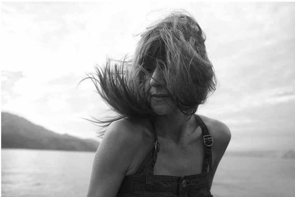
sl.4. Ivan Posavec, Bez naziva, 2018.